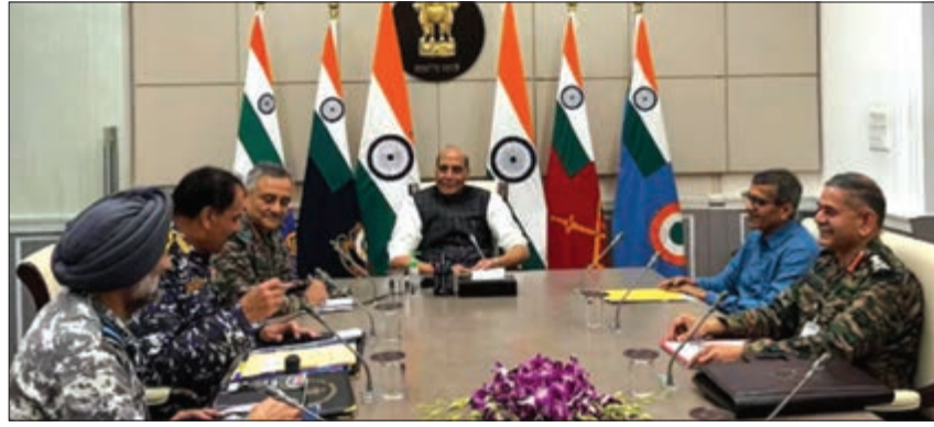
ସେନା ଅଧିକାରୀଙ୍କ ସହ ଆଲୋଚନା କରୁଥିବା ପ୍ରତିରକ୍ଷା ମନ୍ତ୍ରୀ ରାଜନାଥ ସିଂହ । ଏହି ସମୟରେ ସମସ୍ତଙ୍କ ପୂର୍ବରୁ ହସ୍ତ ନେଇ ପାକିସ୍ତାନ ଉପରେ ଭାରତର ଆକ୍ରମଣ ପ୍ରସଙ୍ଗରେ ଏବେ ଏକ ବଡ଼ ଚର୍ଚ୍ଚା ଆରମ୍ଭ ହୋଇଛି ।

ନୂଆଦିଲ୍ଲୀ, ୧୫/୫/୨୦୨୫: ଦେଶ ଏବେ ଏକ ଅସ୍ଥିର ମୁହଁ ଲଢ଼ୁଥିବା ବେଳେ ଦେଶରେ ଯେପରି ଖାଦ୍ୟ ସାମଗ୍ରୀ କଳାବଜାରୀ ନହୁଏ ସେନେଇ କେନ୍ଦ୍ର ସରକାର ଶୁଦ୍ଧବାର ଚେତାବନୀ ଦେଇଛନ୍ତି । ଦେଶର ବ୍ୟବସାୟୀମାନଙ୍କୁ ଖାଦ୍ୟ ସାମଗ୍ରୀ କଳାବଜାରୀ ବା ରକ୍ଷିତ ନ କରିବାକୁ ସ୍ପଷ୍ଟ ଭାବେ ନିର୍ଦ୍ଦେଶ ଜାରି କରିଛନ୍ତି କେନ୍ଦ୍ର ସରକାର । ସରକାର କହିଛନ୍ତି ଯେ ଦେଶରେ ଖାଦ୍ୟ ସାମଗ୍ରୀର ପର୍ଯ୍ୟାପ୍ତ ମହଲକୁ ରହିଛି, ତେଣୁ ଆତଙ୍କିତ ହୋଇ ଅନାବଶ୍ୟକ ଭାବେ ମହଲକୁତ କରିବାର ଆବଶ୍ୟକତା ନାହିଁ । ସେହିପରି କେନ୍ଦ୍ର ଖାଦ୍ୟ ଓ ସାବିଜନୀନ ବନ୍ଧନ ମହାଶାଳୟ ଏକ ବିଦ୍ରୁତିରେ କହିଛି ଯେ ଉତ୍ତର, ଉତ୍ତର ଓ ଅନ୍ୟାନ୍ୟ ଅତ୍ୟାବଶ୍ୟକୀୟ ଖାଦ୍ୟ ସାମଗ୍ରୀର ଯଥେଷ୍ଟ ଗଚ୍ଛିତ ରହିଛି । ସରକାର ବ୍ୟବସାୟୀ ଓ ଖୁରୁବା ବିକ୍ରେତାମାନଙ୍କୁ ବଜାରରେ ସାମଗ୍ରୀର ନିୟମିତ ଯୋଗାଣ ବଜାୟ ରଖିବାକୁ ନିର୍ଦ୍ଦେଶ ଦେଇଛନ୍ତି । ଯଦି ଏଥିରେ ଖୁଲାସା ହୁଏ ତେବେ ମହଲକୁତଦ୍ୱାରା ଏବଂ କୃତ୍ରିମ ଅଭାବ ସୃଷ୍ଟି କରୁଥିବା ବ୍ୟକ୍ତିଙ୍କ ବିରୋଧରେ କଠୋର କାର୍ଯ୍ୟାନୁଷ୍ଠାନ ଗ୍ରହଣ କରାଯିବ । ସାଧାରଣ ଜନତାଙ୍କୁ ମଧ୍ୟ ଆତଙ୍କିତ ନହୋଇ ଆବଶ୍ୟକ ଅନୁଯାୟୀ ସାମଗ୍ରୀ କିଣିବାକୁ ଅନୁରୋଧ କରାଯାଇଛି ।