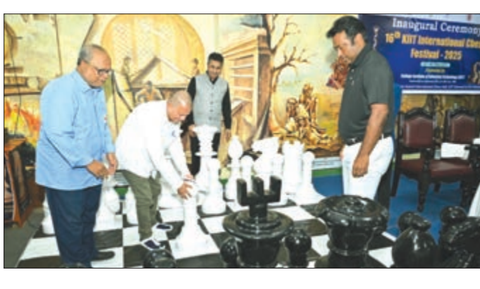
(ଫିଟେ)ର କମିଶନର ତଥା କିସ୍ ଅଭିଜିତ ରୁଗ୍ତ ଟାଇଟଲ ବିଜେତା ଲିଆଖର ପେସ୍ କିଟ୍ ଅନ୍ତର୍ଜାତୀୟ ଚେସ୍ ମହୋତ୍ସବର ଉଦ୍ଘାଟନ କରିଛନ୍ତି ।

ଭୁବନେଶ୍ୱର, ୯/୫/ଏକେନି: ସର୍ବ ଭାରତୀୟ ଚେସ୍ ଫେଡେରେସନ୍ (ଏଆଇସିଏଫ) ତତ୍ତ୍ୱାବଧାନରେ କିଟ୍ ବିଶ୍ୱବିଦ୍ୟାଳୟ ଦ୍ୱାରା ଆୟୋଜିତ ୧୬ଶ କିଟ୍ ଅନ୍ତର୍ଜାତୀୟ ଚେସ୍ ମହୋତ୍ସବ ୨୦୧୫ ଶୁଭକାରୀ ଉଦ୍ଘାଟିତ ହୋଇଛି । ମୁଖ୍ୟ ଅତିଥି ଭାବେ ଏହି କାର୍ଯ୍ୟକ୍ରମକୁ ଉଦ୍ଘାଟନ କରି ଭାରତୀୟ ଚେସ୍ ଟାଇଟଲ, ଅଲିମ୍ପିଆନ୍ ଏବଂ ମେଜର ଧ୍ୟାନ ଚାନ୍ଦ ଖେଳ ରତ୍ନ ପୁରସ୍କାର ବିଜେତା ଲିଆଖର ପେସ୍ କହିଲେ, ଶିକ୍ଷା ଏବଂ କ୍ରୀଡ଼ା ଶିକ୍ଷା ପାଇଁ କିଟ୍ ଓ କିସ୍ ପ୍ରତିଷ୍ଠା ଅତ୍ୟୁତ ସାମଗ୍ରୀ ଦୃଷ୍ଟିକୋଣ ଅନନ୍ୟ । କିଟ୍ ଓ କିସ୍ କ୍ରୀଡ଼ା ଭିତ୍ତିକ ଏବଂ ଚାଲି ଥିବା ଉତ୍ସାହ ହୋଇଥିବା ବେଳେ ଭାରତୀୟ କ୍ରୀଡ଼ା କ୍ଷେତ୍ରରେ ଅତ୍ୟୁତ ସାମଗ୍ରୀ ଗୁରୁତ୍ୱପୂର୍ଣ୍ଣ ଯୋଗଦାନ ରହିଛି । ଏହି ପରିବ୍ରାଜରେ କିଟ୍ ଓ କିସ୍ କ୍ରୀଡ଼ାକୁ ବିଶ୍ୱ ମାନଚିତ୍ରରେ ସ୍ଥାନ ଦେବା ଚାଲି ଦାୟିତ୍ୱ ବୋଲି ଲିଆଖର ପ୍ରତିଶ୍ରୁତି ଦେଇଥିଲେ । ଅନ୍ୟତମ ଅତିଥି ମହାରାଷ୍ଟ୍ର ପୁନେସ୍ଥିତ ଚେସ୍ ଇନ୍ ଷ୍ଟାଲ