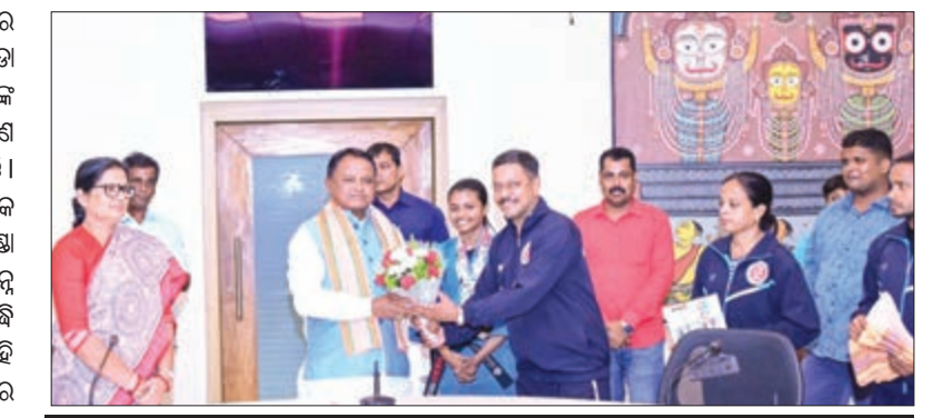
'କୁଡ଼ୋ'କୁ ରାଜ୍ୟସ୍ତରୀୟ ମାନ୍ୟତା ଦେବାକୁ ଅନୁରୋଧ

ଭୁବନେଶ୍ୱର, ୯/୫/ଏକେନି: ଶୁଭକାରୀ ଲୋକସେବା ଭବନରେ ଓଡ଼ିଶା କୁଡ଼ୋ ଆସୋସିଏସନ୍ର ସଦସ୍ୟ, କୋର୍ଡ ଓ ଖେଳାଳିଙ୍କ ସମେତ ୭୦ ଜଣ ମୁଖ୍ୟମନ୍ତ୍ରୀ ମୋହନ ଚରଣ ମାଝୀଙ୍କୁ ଯୌକର୍ମ୍ୟମୂଳକ ସାକ୍ଷାତ କରିଛନ୍ତି । ସୂଚନାଯୋଗ୍ୟ, କୁଡ଼ୋ ଏକ ପ୍ରକାର ମିଶ୍ରିତ ସାମରିକ କଳା, ଯାହା କୁଡ଼ୋ, କରାଟେ ଏବଂ ଟାଏକ୍ୱୋଡୋ ଖେଳର ସମାହାର । ଏହି ଖେଳ ଭାରତର ବିଭିନ୍ନ ରାଜ୍ୟ ସମେତ ବିଦେଶରେ ମଧ୍ୟ ଅନେକ ପ୍ରସିଦ୍ଧି ଲାଭ କରିଛି । ଓଡ଼ିଶାର ଅନେକ ଲିଲ୍ଲେ ଏହି ଖେଳର ଚାଲି ମଧ୍ୟ ଦିଆଯାଇଛି । ଏଣୁ ରାଜ୍ୟରେ କୁଡ଼ୋ ଖେଳର ପ୍ରସାର ପାଇଁ ଏହାକୁ ରାଜ୍ୟସ୍ତରୀୟ ମାନ୍ୟତା ଦେବା ପାଇଁ ଆସୋସିଏସନ୍ ପକ୍ଷରୁ ମୁଖ୍ୟମନ୍ତ୍ରୀଙ୍କୁ ଅନୁରୋଧ କରାଯାଇଛି । ଏ ସମ୍ପର୍କରେ ବିଚାର କରାଯିବ ବୋଲି ମୁଖ୍ୟମନ୍ତ୍ରୀ ପ୍ରତିଶ୍ରୁତି ଦେବା ସହିତ ଅଭ୍ୟାସ କରି ରଖିବା ପାଇଁ ଖେଳାଳିମାନଙ୍କ