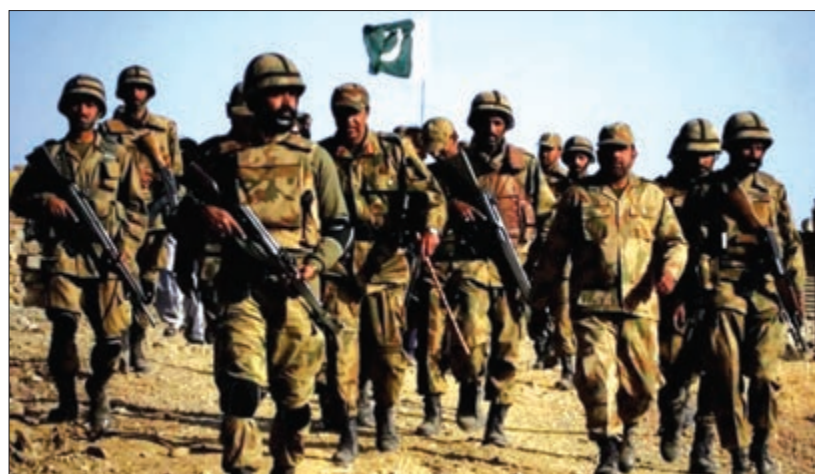
ଏପ୍ରକାର ସାମରିକ ଉପକରଣ, ଅସ୍ତ୍ରଶସ୍ତ୍ର ସଫଳତର ମୁଖ୍ୟ କାରଣ ହେଉଛି, ପାକିସ୍ତାନ ନିଜ ଅତୀତରେ ସୁଦୈର୍ଘ୍ୟ ଏବଂ ଲଗାଏଲକୁ ବିପୁଳ ପରିମାଣରେ ୧୫୫ ଏମ୍ଏମ୍ ଡୋପ ସେଲ ଏବଂ ୧୨୨ ଏମ୍ଏମ୍ ରକେଟ ରୟାଜି କରିଥିଲା । ୨୦୨୩

ଇସଲାମାବାଦ, ୧୫/୫/୨୦୨୫: ଭାରତ ସହ ଆରମ୍ଭ ହୋଇଥିବା ଲଢ଼େଇକୁ ମାତ୍ର ୩/୪ ଦିନ ହିଁ ହୋଇଛି । ବାସ୍ତବିକରେ ପାକିସ୍ତାନର ଅବସ୍ଥା ଖରାପ ହୋଇଯାଇଛି । ଏପ୍ରକାର ହସ୍ତଗତ ହୋଇଥିବା ଏକ ଗୁରୁତ୍ୱପୂର୍ଣ୍ଣ ରିପୋର୍ଟରୁ ଦେଖିବାକୁ ମିଳୁଛି ଯେ ଗୁରୁତ୍ୱପୂର୍ଣ୍ଣ ରିପୋର୍ଟ ଅନୁସାରେ ପାକିସ୍ତାନ ପାଖରେ ମୁଖ୍ୟ ଲଢ଼ିବା ପାଇଁ ଘୋର ଅର୍ଥାଭାବ ରହିଥିବା ବେଳେ ପାକିସ୍ତାନ ସରକାର ଏବେ ନିଜ ବନ୍ଧୁ ରାଷ୍ଟ୍ରକୁ ରଣ ପାଇଁ ଅନୁରୋଧ କରିବା ଆରମ୍ଭ କରିଛନ୍ତି । ଗୋଟିଏ ପଟେ ଯେଉଁଠି ଅଭିଭାବିତା ମୁକ୍ତ ପାଣି (ଆଇଏମ୍ଏସ୍) ଏବଂ ବିଶ୍ୱ ବ୍ୟାଙ୍କ ଭଳି ଅନ୍ତର୍ଜାତୀୟ ଆର୍ଥିକ ଅନୁଷ୍ଠାନ ପାକିସ୍ତାନକୁ ରଣ ଦେବାକୁ ପଛପୁଆ ଦେଉଛନ୍ତି ସେତେବେଳେ ପାକିସ୍ତାନ ପାଇଁ ଅନ୍ୟ ରାଷ୍ଟ୍ରକୁ ରଣ ପାଇଁ ଅନୁରୋଧ କରିବା ପରିସ୍ଥିତି