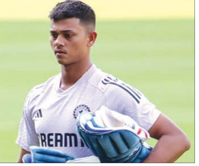
ଦୁବାଇରେ ଟେଷ୍ଟ ଖେଳିବା ବିପକ୍ଷରେ ଭାରତ ପକ୍ଷରୁ ଟେଷ୍ଟ ଟେକ୍ସ କରିଥିଲେ । ସେବେଠାରୁ ସେ ଓପେନ ଭାବେ ପ୍ରଥମ ପଦ୍ୟ ରହିଆସିଛନ୍ତି । ତେଣୁ ପରେ ଭାରତ ପାଇଁ ୧୯ ମ୍ୟାଚ୍ ଖେଳି ବଡ଼ ମଞ୍ଚରେ ସେ ଚମତ୍କାର ପ୍ରଦର୍ଶନ କରିଛନ୍ତି । ଟେଷ୍ଟରେ ଟାଙ୍କି ହାରାହାରି ୫୨ରୁ ଅଧିକ ଥିବାବେଳେ ଏହି ଫର୍ମାଟ୍ରେ ଟାଙ୍କି ନମରେ ତାରି ଶତକ ଓ ୧୦ ଅଶ୍ୱତକ ରହିଛି ।