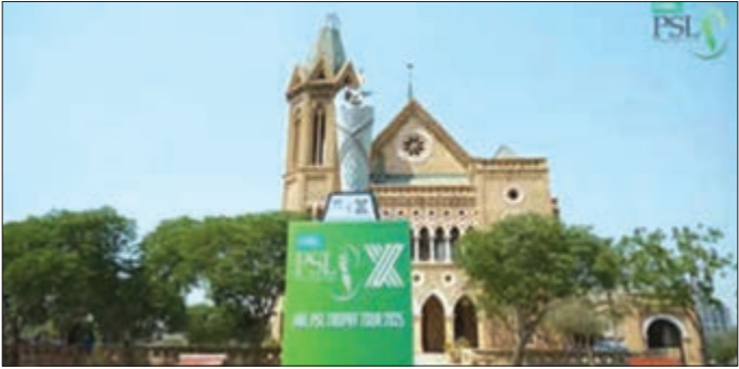
ଉଭୟ ଦଳ ମଧ୍ୟରେ ମଞ୍ଜୁରୀ ଅସମ୍ଭବ: ଇସିବି

ଦୁବାଇ, ୯/୫/ଏକେନି: ଭାରତ- ପାକିସ୍ତାନ ଉଭୟ ଦଳ ମଧ୍ୟରେ ପାକିସ୍ତାନ କ୍ରିକେଟ୍ ବୋର୍ଡ (ପିସିବି)କୁ ନେଇ ଝଟ୍କା ଲାଗିଛି । ପାକିସ୍ତାନ ପ୍ରଦର୍ଶନୀ (ପିଏସ୍ଏଲ)ର ବାକି ମ୍ୟାଚ୍ ଦୁବାଇରେ କରାଯିବ ବୋଲି ଏମିରେଟ୍ସ କ୍ରିକେଟ୍ ବୋର୍ଡ (ଇସିବି) ମଞ୍ଜୁରୀ ଦେଇନାହିଁ । ଭାରତ ଓ ପାକିସ୍ତାନ ମଧ୍ୟରେ ଉଭୟ ଦଳଙ୍କୁ ନେଇ ଯୁବକ ତିନିଟି ଥିବାବେଳେ ଦୁବାଇରେ ପିଏସ୍ଏଲ ମ୍ୟାଚ୍ ମଞ୍ଜୁରୀ ଦେବା ଅସମ୍ଭବ ବୋଲି ଏମିରେଟ୍ସ ବୋର୍ଡ ପକ୍ଷରୁ କୁହାଯାଇଛି । ସୂଚନାଯୋଗ୍ୟ, ପାକିସ୍ତାନ ପ୍ରଦର୍ଶନୀର ବାକି ମ୍ୟାଚ୍ ଦୁବାଇରେ କରାଯିବାର ପିସିବି ଶୁଭକାରୀ ଘୋଷଣା କରିଥିଲା । ଦିନକ ପୂର୍ବରୁ ଭାରତର ଆକ୍ରମଣରେ ରାଞ୍ଜିତପୁରୀ ଶ୍ରୀକୃଷ୍ଣ ବିଶେଷ ଭାବେ କ୍ରିକେଟ୍ ହୋଇଥିବାରୁ ସହାୟକ ହେବାକୁ ଥିବା କରାଯିବ ବୋଲି ଏମିରେଟ୍ସ ଜାଲମୀ ମଧ୍ୟରେ ପିଏସ୍ଏଲ ମ୍ୟାଚ୍ ରଦ୍ଦ ହୋଇଥିଲା । ଏହାପରେ ଦୁର୍ଦ୍ଦିନୀୟ ବିଳମ୍ବିତ କରାଯାଇଥିଲା । ପିସିବି ଅଧିକାରୀ ପିଏସ୍ଏଲର ଅନ୍ତିମ ୮ ମ୍ୟାଚ୍ ଦୁବାଇ କିମ୍ବା ନୋହାରେ କରାଯିବାରୁ ସରକାରଙ୍କୁ ପରାମର୍ଶ ଦେଇଥିଲେ ।