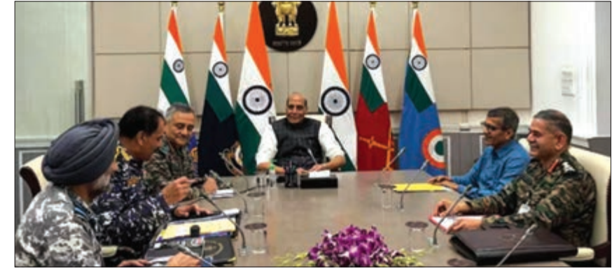
ସେନା ଅଧିକାରୀଙ୍କ ସହ ଆଲୋଚନା କରୁଛନ୍ତି ପ୍ରତିରକ୍ଷା ମନ୍ତ୍ରୀ ରାଜନାଥ ସିଂହ । ଏହି ସମୟରେ ସମସ୍ତଙ୍କ ପୂର୍ବରୁ ହସ୍ତ ନେଇ ପାକିସ୍ତାନ ଉପରେ ଭାରତର ଆକ୍ରମଣ ପ୍ରସଙ୍ଗରେ ଏବେ ଏକ ବଡ଼ ତର୍କ ଆରମ୍ଭ ହୋଇଛି ।

ନୂଆଦିଲ୍ଲୀ, ୯/୫/ଏକ୍ସପ୍ରେସ୍: ଦେଶ ଏବେ ଏକ ଅସ୍ଥିତ ମୁକ୍ତ ଲଢ଼ୁଥିବା ବେଳେ ଦେଶରେ ଯେପରି ଖାଦ୍ୟ ସାମଗ୍ରୀ କଳାବଜାରୀ ନହୁଏ ସେନେଇ କେନ୍ଦ୍ର ସରକାର ଶୁଦ୍ଧିକାର ଚେତାବନୀ ଦେଇଛନ୍ତି । ଦେଶର ବ୍ୟବସାୟୀମାନଙ୍କୁ ଖାଦ୍ୟ ସାମଗ୍ରୀ କଳାବଜାରୀ ବା ରହିତ ନ କରିବାକୁ ସ୍ପଷ୍ଟ ଭାବେ ନିର୍ଦ୍ଦେଶ ଜାରି କରିଛନ୍ତି କେନ୍ଦ୍ର ସରକାର । ସରକାର କହିଛନ୍ତି ଯେ ଦେଶରେ ଖାଦ୍ୟ ସାମଗ୍ରୀର ପର୍ଯ୍ୟାପ୍ତ ମହତ୍ତ୍ୱ ରହିଛି, ତେଣୁ ଆତଙ୍କିତ ହୋଇ ଅନାବଶ୍ୟକ ଭାବେ ମହତ୍ତ୍ୱ କରିବାର ଆବଶ୍ୟକତା ନାହିଁ । ସେହିପରି କେନ୍ଦ୍ର ଖାଦ୍ୟ ଓ ସାବିଜନୀନ ବନ୍ଧନ ମନ୍ତ୍ରାଳୟ ଏକ ବିବୃତିରେ କହିଛି ଯେ ରାଜ୍ୟ, ରାଜକ ଓ ଅନ୍ୟାନ୍ୟ ଅତ୍ୟାବଶ୍ୟକୀୟ ଖାଦ୍ୟ ସାମଗ୍ରୀର ଯଥେଷ୍ଟ ଗଚ୍ଛିତ ରହିଛି । ସରକାର ବ୍ୟବସାୟୀ ଓ ଖୁରୁବା ବିକ୍ରୋମାନଙ୍କୁ ବଜାରରେ ସାମଗ୍ରୀର ନିୟମିତ ଯୋଗାଣ ବଜାୟ ରଖିବାକୁ ନିର୍ଦ୍ଦେଶ ଦେଇଛନ୍ତି । ଯଦି ଏଥିରେ ଖୁଲାସି ହୁଏ ତେବେ ମହତ୍ତ୍ୱଦାୟୀ ଏବଂ କୁଚ୍ଛିନ ଅଭାବ ସୃଷ୍ଟି କରୁଥିବା ବ୍ୟକ୍ତିଙ୍କ ବିରୋଧରେ କଠୋର କାର୍ଯ୍ୟାନୁଷ୍ଠାନ ଗ୍ରହଣ କରାଯିବ । ସାଧାରଣ ଜନତାଙ୍କୁ ମଧ୍ୟ ଆତଙ୍କିତ ନହୋଇ ଆବଶ୍ୟକ ଅନୁଯାୟୀ ସାମଗ୍ରୀ କିଣିବାକୁ ଅନୁରୋଧ କରାଯାଇଛି ।