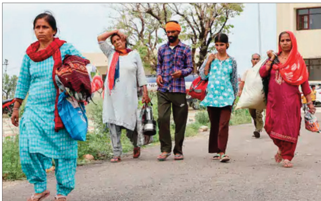
ଶନି ସେକ୍ଟରର ସମାଜବାଦରେ ଅନେକ ଲୋକଙ୍କ ଘରଦ୍ୱାରା ଭଙ୍ଗିଯାଇଥିବା ବେଳେ କିଛି ଲୋକ ସେମାନଙ୍କ ସମ୍ପର୍କୀୟଙ୍କୁ ହରାଇଛନ୍ତି ।