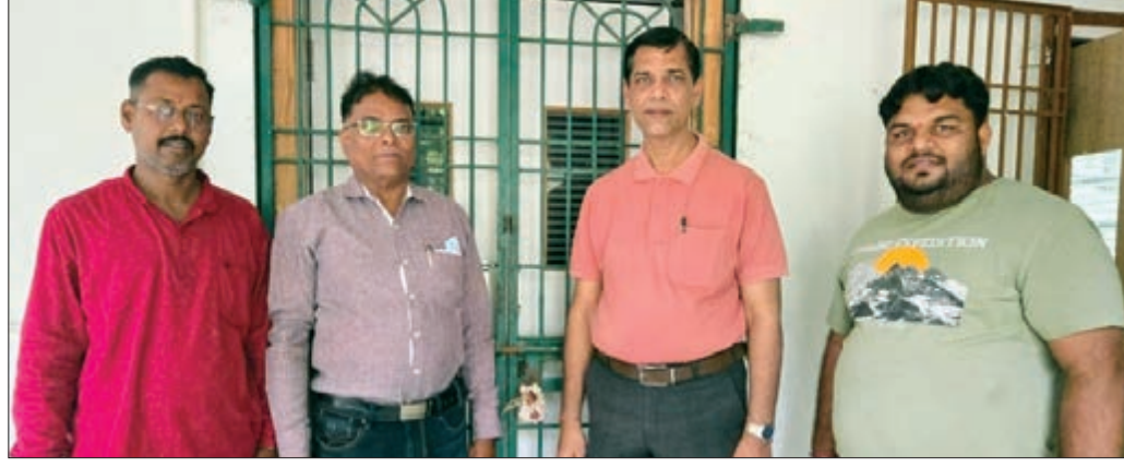
ଶନିବାର ଅପରାହ୍ନରେ ଆସି ପଢ଼ା ହେବ । ତାରିଖରୁ ଯୁକ୍ତ ୨ କଲାର ପରୀକ୍ଷା ଆରମ୍ଭ ହେବ । ଉଚ୍ଚ ମାଧ୍ୟମିକ ବିଦ୍ୟାଳୟ ଓ କରବୁଲି ଶକୁନ୍ତଳା ସରକାରୀ ଉଚ୍ଚ