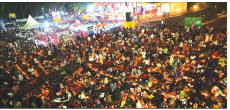
କାଗର ଉପଲକ୍ଷେ ପ୍ରଭୁ ଶ୍ରୀଲିଙ୍ଗରାଜଙ୍କ ମନ୍ଦିରର ଦୃଶ୍ୟ