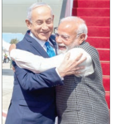
ଇସ୍ରାଏଲ୍ ଗସ୍ତରେ ଯାଇଥିବା ପ୍ରଧାନମନ୍ତ୍ରୀ ନରେନ୍ଦ୍ର ମୋଦୀଙ୍କୁ ଇସ୍ରାଏଲ୍ ପ୍ରଧାନମନ୍ତ୍ରୀ ବେଞ୍ଜାମିନ୍ ନେତାନୟାହୁ ବିମାନବନ୍ଦରେ ସ୍ଵାଗତ କରୁଛନ୍ତି ।

ପ୍ରଧାନମନ୍ତ୍ରୀ ନରେନ୍ଦ୍ର ମୋଦୀ ରୁଧିରୀ ଦିନ ଠାରୁ ଦୁଇ ଦିନିଆ ଇସ୍ରାଏଲ୍ ଗସ୍ତରେ ଯାଇ ସେଠାରେ ପହଞ୍ଚିଛନ୍ତି । ଇସ୍ରାଏଲ୍ ପ୍ରଧାନମନ୍ତ୍ରୀ ବେଞ୍ଜାମିନ୍ ନେତାନୟାହୁ ଏବଂ ତାଙ୍କ ପତ୍ନୀ ସାରା ନେତାନୟାହୁ ବେନ ଗୁରିଅର୍ ଇସ୍ରାଏଲ୍ ସମରାଜ୍ୟରେ ବିମାନବନ୍ଦରେ ଉପସ୍ଥିତ ରହି ପ୍ରଧାନମନ୍ତ୍ରୀ ମୋଦୀଙ୍କୁ ସ୍ଵାଗତ କରିଥିଲେ । ପରେ ଏହି ବିମାନବନ୍ଦରେ ହିଁ ସ୍ଵତନ୍ତ୍ର ଭାବେ ବ୍ୟବସ୍ଥିତ ରୁମ୍ରେ ନେତାନୟାହୁ ଏବଂ ମୋଦୀ ବ୍ୟକ୍ତିଗତ ଆଲୋଚନା କରିଥିଲେ । ଏହି ସମୟରେ ସାରା ନେତାନୟାହୁ ମଧ୍ୟ ଉପସ୍ଥିତ ଥିଲେ । ମୋଦୀଙ୍କ ସ୍ଵାଗତ ପାଇଁ ବିମାନବନ୍ଦରୁ ମୋଦୀଙ୍କ ଯିବା ରାଷ୍ଟ୍ରଗୁଡ଼ିକରେ ଛିନ୍ନଗଣା ପତାକା ଲଗାଯାଇଥିବା ଦେଖିବାକୁ ମିଳିଛି । ଏଠାରୁ ମୋଦୀଙ୍କ ପାଇଁ ବ୍ୟବସ୍ଥା କରାଯାଇଥିବା ହୋଟେଲକୁ ପ୍ରଧାନମନ୍ତ୍ରୀ ମୋଦୀ ଯାଇଥିଲେ । ମୋଦୀଙ୍କ ପ୍ରବାସୀ ଭାରତୀୟମାନେ ପାରମ୍ପରିକ ନୃତ୍ୟ ସମ୍ପର୍କ ପରିବେଷଣ ପୂର୍ବକ ସ୍ଵାଗତ କରିଥିଲେ । ପରେ ମୋଦୀ ଇସ୍ରାଏଲ୍ ସଂସଦ 'ନେସେଟ୍'କୁ ସେଥିପ୍ରତି କହିଛନ୍ତି । ନେସେଟ୍ ସମ୍ବେଧନା କରିବା ପରିସ୍ଠେତିରେ ମୋଦୀ, ଇସ୍ରାଏଲ୍ ଉପରେ ହମାସ୍ ଆକ୍ରମଣକୁ ତୀବ୍ର ନିନ୍ଦା କରିଥିଲେ । ମୋଦୀ ଇସ୍ରାଏଲ୍ ସମାଜରେ ସମ୍ବେଧନା କରି କହିଥିଲେ ଯେ, ଆମେ ମୋଦୀଙ୍କ ସହ ଉପସ୍ଥିତ ରହି, ଭାରତ ଦାର୍ଢ଼ ସମର୍ଥନ ଧରି ଆକ୍ରମଣରେ ଶିକାର ହୋଇଥିବାକୁ >>>