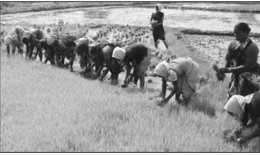
ଦିନ ପର୍ଯ୍ୟନ୍ତ ସେନାମାନଙ୍କ ଆର୍ଥିକ ଆଶା ଯାଏ । ରାଜ୍ୟରେ ଅର୍ଥକରୀ ଓ ବ୍ୟବସାୟିକ ଫସଲ ହିସାବରେ ୬ ଲକ୍ଷ ହେକ୍ଟର ପରିପରିବା, ୬ ଲକ୍ଷ ହେକ୍ଟର ଫଳ, ୨୦୦୦୦ ହେକ୍ଟର ଫୁଲ, ୧୦୦୦୦ ହେକ୍ଟର ପାନ, ୫୦୦୦୦ ହେକ୍ଟର ଆଖୁ, ୨ ଲକ୍ଷ ହେକ୍ଟର କପା, ୩୦୦୦୦ ହେକ୍ଟର ଝୋଟ, ୧୦୦୦୦ ହେକ୍ଟର ଖିରିପାୟ କୃଷି, ୨୦୦୦୦ ହେକ୍ଟର ଅଳ, ୩୦୦୦୦ ହେକ୍ଟର ହଳଦି, ଅଧିକ ପାମ, ଷ୍ଟାପୋ, ଗୁଣ୍ଡାମ, ଫୁଟ, ହାଲଡ୍ରୁଟ ଚେନ୍ଦୁଳି ଇତ୍ୟାଦି ଗଣ ହୋଇ ପାରିବ । ପୁଞ୍ଜିଗଣା ଗଣ ପାଖରେ ସମୃଦ୍ଧ କୃଷି ପଦ୍ଧତି ହିସାବରେ ଧାନ, ମାଈ ଫଳ, ପିପିରିନା ଓ କୁରୁମା ପାଳନ କରାଯାଇ ପାରିବ । ଫସଲ ବିକିଧିକରଣ କଲେ ବର୍ଷସାରା କର୍ମନିୟୁତ ଓ ରୋଜଗାର ବୃଦ୍ଧି ସହିତ ପରିବେଶ ସୁରକ୍ଷିତ ରହିବ । ଏହାଦ୍ୱାରା କୃଷକ କଲ୍ୟାଣ ସାଧିତ ହୋଇ ପାରିବ । ଏଥି ପାଇଁ କୃଷି ବିଭାଗ ଆବଶ୍ୟକ ବିହନ, ସାର, ଜୈବ ସାର, ଜୈବ କାର୍ବୋନିକ ଇତ୍ୟାଦି ଠିକ୍ ସମୟରେ ଯୋଗାଇ ଦେବା ଆବଶ୍ୟକ । କୃଷି ଗଣର ସଠିକ୍ ବିନିଯୋଗ ପାଇଁ ଉଚିତ କୃଷି ସାମଗ୍ରୀ ଓ ନଗଦ ଆକରରେ ବ୍ୟାଙ୍କ ଓ ସମବାୟ ସମିତି ଯୋଗାଇବା ଏକ ଉପଯୁକ୍ତ ପଦକ୍ଷେପ । ରାଜ୍ୟରେ ଅଧିକ ହୋଇଥିବା ସୁତା କଳ, ବିଦି କଳ ଓ ଷ୍ଟେଟ କଳଗୁଡ଼ିକର ପୁନରୁଦ୍ଧାର ଆବଶ୍ୟକ ।

ପ୍ରତିକୂଳ ଜଳବାୟୁ । ନୂତନ ପ୍ରଯୁକ୍ତିବିଦ୍ୟା ଓ ଅବ୍ୟାଧିକ ପରିଶୁଦ୍ଧ କୃଷି, ଫରମାସ କୃଷି, ଜଳବାୟୁ ସହନଶୀଳ କୃଷି, ଜୈବିକ ଓ ପ୍ରାକୃତିକ କୃଷି ପ୍ରୟୋଗ ପାଇଁ କୃଷକମାନଙ୍କୁ ଉତ୍ତମ ପ୍ରଶିକ୍ଷଣ ସହିତ ଅଧିକ ସାମ୍ପଦ କୃଷକ କ୍ଷେତ୍ର ବିଦ୍ୟାଳୟ ପ୍ରତିଷ୍ଠା କରିବା ଆବଶ୍ୟକ । କୃଷି ବିଭାଗ ନିକଟରେ ଆବଶ୍ୟକ ସାମଗ୍ରୀ ପ୍ରସ୍ତୁତକରଣ କୃଷି କର୍ମୀ ନଥିବାରୁ ଏହା ହୋଇପାରୁ ନାହିଁ । ରାଜ୍ୟରେ ଗବେଷଣା, ଉତ୍ପାଦନ ଓ ସମ୍ପ୍ରଦାନ ପାଇଁ ଅଧିକ ବ୍ୟୟ ବରାଦ ଆବଶ୍ୟକ । ରାଜ୍ୟର ମରୁଡ଼ି ପ୍ରଦେଶ ବ୍ଲକ୍‌ଗୁଡ଼ିକରେ କେତେକ ଗ୍ରାମରେ ପରାମର୍ଶଦାତା ଭାବରେ ଜଳବାୟୁ ଚଳୁଥିବା କୃଷି କୌଶଳ ଅନୁସରଣ କରାଯିବା ଉଚିତ । ଗ୍ରାମୀଣ ଗଣମାନଙ୍କ ସମସ୍ୟା ସମାଧାନ ପାଇଁ ସହକାରୀ ପ୍ରଯୁକ୍ତିବିଦ୍ୟା ବିଭାଗ ଓ ସହକାରୀ ବିହନ ନିର୍ବାଚନ ସରକାରୀ, ବେସରକାରୀ ଓ ଗଣମାନଙ୍କ ସହକାରୀରେ ହୋଇ ପାରିବ ।