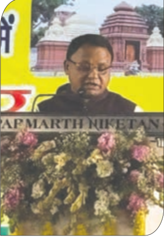
ଭୁବନେଶ୍ୱର, ୨୫/୨/୨୬-ଏନ୍ଏସ୍ଏସ୍: ଶ୍ରୀ ଜଗନ୍ନାଥ ମନ୍ଦିରର ଉଦ୍ଘାଟନ କେବଳ ଏକ ସ୍ଥଳୀୟ କାର୍ଯ୍ୟକ୍ରମ ନୁହେଁ, ଏହା ଆଧ୍ୟାତ୍ମିକ ଚେତନାର ପୁନଃଜାଗରଣ ବୋଲି ପ୍ରଧାନମନ୍ତ୍ରୀ ପବିତ୍ର ଭାବେ ପ୍ରକାଶ କରିଛନ୍ତି ।

ପୁନଃଜାଗରଣ ବୋଲି ପ୍ରଧାନମନ୍ତ୍ରୀ ପବିତ୍ର ଭାବେ ପ୍ରକାଶ କରିଛନ୍ତି । ମନ୍ଦିର ଉଦ୍ଘାଟନ କାର୍ଯ୍ୟକ୍ରମରେ ପ୍ରଧାନମନ୍ତ୍ରୀଙ୍କ ସମ୍ପୂର୍ଣ୍ଣ ସମ୍ପାଦନା ଉପରେ ଗୁରୁତ୍ୱ ଦିଆଯାଇଛି । ଏହି ଅବସରରେ ଗଣ୍ଡା ଆକାଶରେ ଅନ୍ତର୍ଗତ କରି ମୁଖ୍ୟମନ୍ତ୍ରୀ କହିଛନ୍ତି ଯେ, ଏହି ଜଗନ୍ନାଥ ମନ୍ଦିର ଓଡ଼ିଶାର ଭକ୍ତି ପରମ୍ପରା ଓ ଭୁବନେଶ୍ୱର ଆଧ୍ୟାତ୍ମିକ ମହିମାକୁ ଏକତ୍ର କରି ଜାତୀୟ ଏକତାର ବାଣୀ ପ୍ରସାର କରିବ । ମହାପ୍ରଭୁ ଶ୍ରୀଜଗନ୍ନାଥଙ୍କ ଆଶୀର୍ବାଦ କାମନା କରି ମୁଖ୍ୟମନ୍ତ୍ରୀ ପୂଜି କହିଛନ୍ତି ଯେ ପ୍ରଧାନମନ୍ତ୍ରୀଙ୍କ ଦ୍ୱାରା ଉଦ୍ଘାଟିତ ମନ୍ଦିର ଏକ ସ୍ୱତନ୍ତ୍ର ଆଧ୍ୟାତ୍ମିକ ସେନ୍ଟର ଭାବେ ଗଠନ ହେବ । ଶ୍ରୀଜଗନ୍ନାଥଙ୍କ ସଂସ୍କୃତି ସମାଜ, ସ୍ଥାନୀୟ ଲୋକଙ୍କୁ ଏକତ୍ର କରିବା ଏବଂ ସମାଜର ଉନ୍ନତି ପାଇଁ ଏହା ଏକ ସୁଯୋଗ ବୋଲି ସେ କହିଛନ୍ତି ।