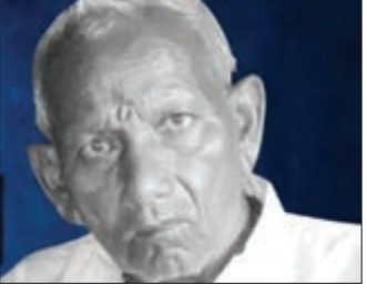
ଉତ୍ତରପ୍ରଦେଶରୁ ଆଉ ଏକ ପିତୃହତ୍ୟା ମାମଲାରେ ଜଣେ ପୁଅ ତାଙ୍କ ବାପାଙ୍କୁ ଜୀଆଡ଼ା ଜାଳିଦେଲା।

ଉତ୍ତରପ୍ରଦେଶରୁ ଆଉ ଏକ ପିତୃହତ୍ୟା ମାମଲାରେ ଜଣେ ପୁଅ ତାଙ୍କ ବାପାଙ୍କୁ ଜୀଆଡ଼ା ଜାଳିଦେଲା। ଏହା ଲକ୍ଷ୍ୟ ରଖି ଏପିଲ ପହିଲା ୨୦% ଇଥାନଲ ମିଶ୍ରିତ ପେଟ୍ରୋଲ ବିକ୍ରୟ ବାଧ୍ୟତାମୂଳକ କରାଯାଇଛି। ଏହା ଲକ୍ଷ୍ୟ ରଖି ଏପିଲ ପହିଲା ୨୦% ଇଥାନଲ ମିଶ୍ରିତ ପେଟ୍ରୋଲ ବିକ୍ରୟ ବାଧ୍ୟତାମୂଳକ କରାଯାଇଛି।