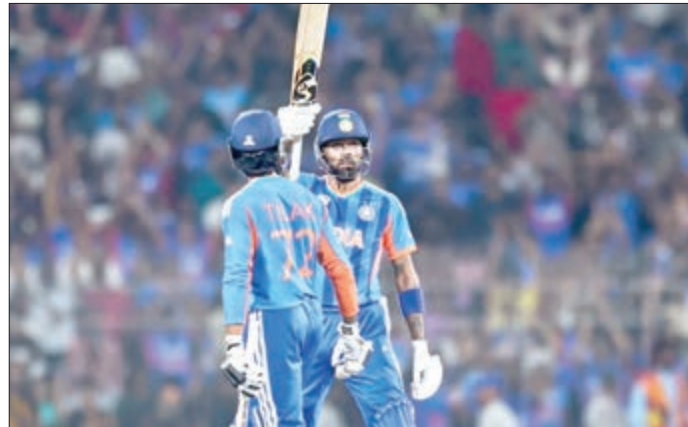
ଚେନ୍ନାଇରେ ଖେଳାଯାଇଥିବା ସୁପର-୮ ପର୍ଯ୍ୟାୟରେ ଦ୍ୱିତୀୟ ମ୍ୟାଚରେ ଭାରତ, ଜିୟାଫ୍ରେକୁ ୭୨ ରନରେ ପରାସ୍ତ କରିବାରେ ସଫଳ ହୋଇଛି।

ଚେନ୍ନାଇ, ୨୬/୧/୧୭: ଚେନ୍ନାଇରେ ଚେପକ୍ ଷ୍ଟାଡ଼ିୟମରେ ଖେଳାଯାଇଥିବା ସୁପର-୮ ପର୍ଯ୍ୟାୟରେ ଦ୍ୱିତୀୟ ମ୍ୟାଚରେ ଭାରତ, ଜିୟାଫ୍ରେକୁ ୭୨ ରନରେ ପରାସ୍ତ କରିବାରେ ସଫଳ ହୋଇଛି। ଏହି ବିଜୟ ସହ ଭାରତ ସେମିଫାଇନାଲକୁ ଉନ୍ନତ ହେବା ଆଶାକୁ ଛାଡିବାର ସମ୍ଭାବନା ରହିଛି। ଗୁରୁବାର ଖେଳାଯାଇଥିବା ଏହି ମ୍ୟାଚ ଭାରତ ପାଇଁ 'କର ବା ମର' ସ୍ଥିତି ସୃଷ୍ଟି କରିଥିଲା। ଭାରତ ସୁପର-୮ର ପ୍ରଥମ ମ୍ୟାଚରେ ସାଉଥ ଆଫ୍ରିକା ଠାରୁ ୭୨ ରନ ବ୍ୟବଧାନରେ ପରାସ୍ତ ହୋଇଥିବା ବେଳେ ସେମିଫାଇନାଲ ଆଶା ମନିନ ପଡ଼ିଯାଇଥିଲା। ତେବେ ଆଜିର ଏହି ବିଜୟ ଭାରତୀୟ ଖେଳାଳିଙ୍କ ଆତ୍ମବିଶ୍ୱାସ ପ୍ରୋତ୍ସାହିତ କରିବାରେ ସହାୟକ ହେବ ବୋଲି କୁହାଯାଉଛି।