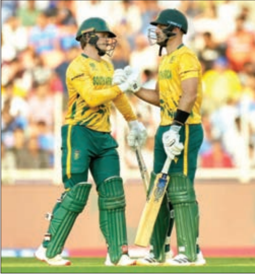
ଫ୍ରେଣ୍ଡ୍‌ସ୍ ଟ୍ରାଫିକ୍ ଟ୍ରକେଟରେ, ସେତେବେଳେ କରିଥିବା ଭାରତୀୟ ଏବଂ ଦକ୍ଷିଣ ଆଫ୍ରିକୀୟ ଖେଳାଳୀମାନଙ୍କ ମଧ୍ୟରେ ହୋଇଥିବା ସମ୍ମାନାର୍ପଣ ମୁହାଁମୁହିଁର ଚିତ୍ର।

ଅହମଦାବାଦ, ୨୬/୧/୧୭: ୧୦ ବିଶ୍ୱକପରେ ସାଉଥ ଆଫ୍ରିକା ସୁପର ୮ ପର୍ଯ୍ୟାୟରେ ନିଜ ବିଜୟ ଧାରା ବଜାୟ ରଖିଛି। ଗୁରୁବାର ଖେଳାଯାଇଥିବା ଫ୍ରେଣ୍ଡ୍‌ସ୍ ଟ୍ରାଫିକ୍ ଟ୍ରକେଟରେ ସାଉଥ ଆଫ୍ରିକା ଏହାର ଲଗାତାର ଦ୍ୱିତୀୟ ବିଜୟ ହାସଲ କରିଛି। ଫ୍ରେଣ୍ଡ୍‌ସ୍ ଟ୍ରାଫିକ୍ ଟ୍ରକେଟରେ ସାଉଥ ଆଫ୍ରିକା ୧୯୭ ରନରେ ପରାସ୍ତ ହୋଇଥିଲା। ଏହାପୂର୍ବରୁ ସାଉଥ ଆଫ୍ରିକା ନିଜ ସୁପର-୮ ପର୍ଯ୍ୟାୟରେ ପ୍ରଥମ ମ୍ୟାଚରେ ଭାରତକୁ ୭୨ ରନରେ ପରାସ୍ତ କରିବାରେ ସଫଳ ହୋଇଥିଲା।