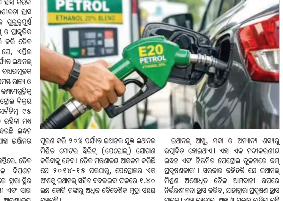
ଏପିଲ ପହିଲା ୨୦% ଇଥାନଲ ମିଶ୍ରିତ ପେଟ୍ରୋଲ ବିକ୍ରୟ ବାଧ୍ୟତାମୂଳକ କରାଯାଇଛି।

ନୂଆଦିଲ୍ଲୀ, ୨୬/୧/୧୭: ପ୍ରଦୂଷଣ ହ୍ରାସ କରିବା ଓ ଚୈତନ୍ୟ ଆନ୍ଦୋଳନ ଉପରେ ନିର୍ଭରଶୀଳତା ହ୍ରାସ କରିବା ପାଇଁ କେନ୍ଦ୍ର ସରକାର ଏକ ଗୁରୁତ୍ୱପୂର୍ଣ୍ଣ ପଦକ୍ଷେପ ନେଇଛନ୍ତି। ପେଟ୍ରୋଲିୟମ୍ ଓ ପ୍ରାକୃତିକ ଗ୍ୟାସ୍ ମନ୍ତ୍ରାଳୟ ଏକ ବିଶ୍ୱାସୀ ଲାଠି କରି ଚୈତନ୍ୟ ଆନ୍ଦୋଳନକୁ ଉତ୍ତମ ଭାବେ ସମର୍ଥନ ଦେଇଛନ୍ତି। ଏପିଲ ପହିଲା ୨୦% ଇଥାନଲ ମିଶ୍ରିତ ପେଟ୍ରୋଲ ବିକ୍ରୟ ବାଧ୍ୟତାମୂଳକ କରାଯାଇଛି। ଏହା ଲକ୍ଷ୍ୟ ରଖି ଏପିଲ ପହିଲା ୨୦% ଇଥାନଲ ମିଶ୍ରିତ ପେଟ୍ରୋଲ ବିକ୍ରୟ ବାଧ୍ୟତାମୂଳକ କରାଯାଇଛି। ଏହା ଲକ୍ଷ୍ୟ ରଖି ଏପିଲ ପହିଲା ୨୦% ଇଥାନଲ ମିଶ୍ରିତ ପେଟ୍ରୋଲ ବିକ୍ରୟ ବାଧ୍ୟତାମୂଳକ କରାଯାଇଛି।