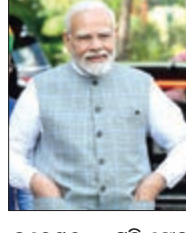
ନିୟୁତ ଫଲୋଅର୍ସ ଆନ୍ଦୋଳନ ଗୋଟିଏ 'ଇନ୍‌ଷ୍ଟାଗ୍ରାମ'ରେ ୧୦୦ ନିୟୁତ ଫଲୋଅର୍ସ ହାସଲ କରିବାରେ ସଫଳ ହୋଇଛି।

ନୂଆଦିଲ୍ଲୀ, ୨୬/୧/୧୭: ମୋଦୀଙ୍କ ୧୦୦ ନିୟୁତ ଫଲୋଅର୍ସ ଆନ୍ଦୋଳନ ଗୋଟିଏ 'ଇନ୍‌ଷ୍ଟାଗ୍ରାମ'ରେ ୧୦୦ ନିୟୁତ (୧୦ କୋଟି) ଫଲୋଅର୍ସ ହାସଲ କରିବାରେ ସଫଳ ହୋଇଛି। ଏହା ଲକ୍ଷ୍ୟ ରଖି ଏପିଲ ପହିଲା ୨୦% ଇଥାନଲ ମିଶ୍ରିତ ପେଟ୍ରୋଲ ବିକ୍ରୟ ବାଧ୍ୟତାମୂଳକ କରାଯାଇଛି। ଏହା ଲକ୍ଷ୍ୟ ରଖି ଏପିଲ ପହିଲା ୨୦% ଇଥାନଲ ମିଶ୍ରିତ ପେଟ୍ରୋଲ ବିକ୍ରୟ ବାଧ୍ୟତାମୂଳକ କରାଯାଇଛି।