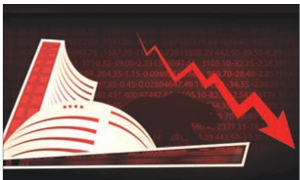
ତାଲିକାଭୁକ୍ତ କମ୍ପାନୀଗୁଡ଼ିକର ବଜାର ପୁଞ୍ଜି ପ୍ରାୟ ୧୧ ଲକ୍ଷ କୋଟି ହ୍ରାସ ପାଇଥିଲା । ୩୦ ସେନସେକ୍ସ ଷ୍ଟକ୍ ମଧ୍ୟରୁ ୨୭ଟିରେ ହ୍ରାସ ପରିଲକ୍ଷିତ ହୋଇଥିଲା ।

ଦୁଆବିଲ୍ଲା, ୧୨/୧୧/୨୦୨୧: କେନ୍ଦ୍ର ଅର୍ଥମନ୍ତ୍ରୀ ନିର୍ମଳା ସୀତାରମଣ ବଜେଟ୍ ଉପସ୍ଥାପନ କରିବା ପରେ ପରେ ଶେୟାର ମାର୍କେଟ୍ରେ ଏକ ଜବରଦସ୍ତ ହ୍ରାସ ଦେଖିବାକୁ ମିଳିଛି । ସେନସେକ୍ସ ୧,୫୪୬ ପଏଣ୍ଟ୍ (୨%) ହ୍ରାସ ପାଇଥିବା ବେଳେ ନିଫ୍ଟି ୪୯୫ ପଏଣ୍ଟ୍ ହ୍ରାସ ପାଇଛି । ସେନସେକ୍ସ ୮୦,୭୨୨ରେ ବନ୍ଦ ହୋଇଥିବା ବେଳେ ନିଫ୍ଟି ୨୪,୮୨୫ରେ ବନ୍ଦ ହୋଇଛି । ତେବେ ବଜେଟ୍ ଆସିବା ଦିନ କିମ୍ବା ବଜେଟ୍ ପୂର୍ବ ଦିନରେ ଏପ୍ରକାର ହ୍ରାସ ପୁଞ୍ଜି ନିବେଶକଙ୍କୁ ଭୟଭୀତ କରିଦେଇଛି । ଆଜି ଦିନରେ ନିବେଶକମାନେ ପ୍ରାୟ ୧୧ ଲକ୍ଷ କୋଟି ଟଙ୍କା ହରାଇଛନ୍ତି । ଗତ ସାତ ବର୍ଷ ମଧ୍ୟରେ ବଜେଟ୍ ଦିନ ଏହା ସବୁଠାରୁ ବଡ଼ ହ୍ରାସ । ପୂର୍ବରୁ, ୨୦୨୦-୨୧ ବଜେଟ୍ ଦିନ, ସେନସେକ୍ସ ୯୮୭ ପଏଣ୍ଟ୍ ଏବଂ ନିଫ୍ଟି ୩୦୦ ପଏଣ୍ଟ୍ ହ୍ରାସ ପାଇ ବନ୍ଦ ହୋଇଥିଲା । ଦୁଇବର୍ଷ ଯାକ ଉପରେ ସିଲ୍ଭିକାରିକ୍ସ ଗ୍ରାହକଙ୍କୁ ଟ୍ୟାକ୍ସ (ଏସ୍‌ଟି) ୦.୦୨% ରୁ ୦.୦୫% କୁ ବୃଦ୍ଧି କରିବା ଏବଂ ବିକଳ ପ୍ରମିୟମ୍ ଏବଂ ବ୍ୟାୟାମ ବିକଳ ଉପରେ ମଧ୍ୟ ଏସ୍‌ଟି ୦.୧୫%କୁ ବୃଦ୍ଧି କରାଯିବା ନେଇ ସୀତାରମଣ ବଜେଟ୍ରେ ଏକ ପ୍ରସ୍ତାବ ଉପସ୍ଥାପନ କରିବା ପରେ ପରେ ଶେୟାର ମାର୍କେଟ୍ରେ ଭୟଙ୍କର ହ୍ରାସ ଦେଖିବାକୁ ମିଳିଥିଲା । ପ୍ରଥମରୁ ଭଲ ଛୁଟିରେ ଥିବା ସେନସେକ୍ସରେ ଏପ୍ରକାର ହ୍ରାସ ବିଏସ୍‌ରେ