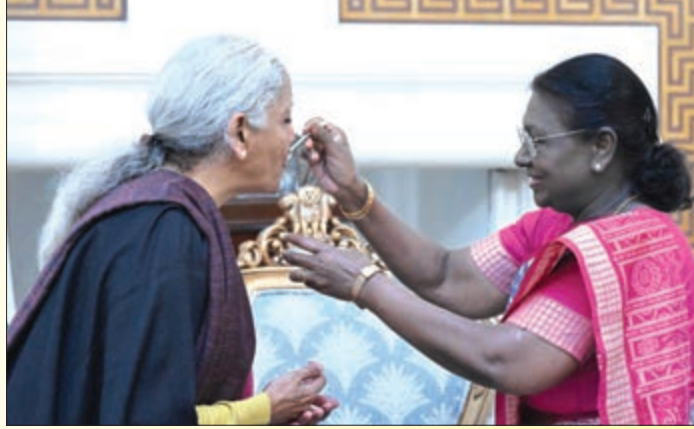
ରାଷ୍ଟ୍ରପତିଙ୍କ ଠାରୁ ଅନୁମତି ପାଇବା ପରେ ସକାଳ ୧୦ଟାରେ ଅର୍ଥମନ୍ତ୍ରୀ ସିଧାସଳଖ ଏସବୁ ଭବନରେ ପହଞ୍ଚିଥିଲେ । ୧୦ଟା ୧୫ମିନିଟ୍ରେ ପ୍ରଧାନମନ୍ତ୍ରୀ ନରେନ୍ଦ୍ର ମୋଦୀଙ୍କ ଅଧିକାରରେ କେନ୍ଦ୍ର କ୍ୟାବିନେଟ୍ ଏସବୁ ଭବନ ଭିତରେ ଏକ ଗୁରୁତ୍ୱପୂର୍ଣ୍ଣ ବୈଠକ ଅନୁଷ୍ଠିତ ହୋଇଥିଲା । ଏହି ସଂକ୍ଷିପ୍ତ ବୈଠକରେ କେନ୍ଦ୍ର ଆନୁଷ୍ଠାନିକ ଭାବରେ ବଜେଟ୍ ଅନୁମୋଦନ କରିଥିଲା । କାରଣ ନିୟମ ପ୍ରାଚୀନ କ୍ୟାବିନେଟ୍ ଅନୁମୋଦନ ବିନା ବଜେଟ୍ ଉପସ୍ଥାପନ କରାଯାଇପାରିବ ନାହିଁ ।

ବଜେଟ୍ ପରମ୍ପରା ଅନ୍ତର୍ଗତ ରବିବାର ସକାଳ ୯ଟା ୧୫ ମିନିଟ୍ରେ କେନ୍ଦ୍ର ଅର୍ଥମନ୍ତ୍ରୀ ନିର୍ମଳା ସୀତାରମଣ ରାଷ୍ଟ୍ରପତି ଭବନରେ ପହଞ୍ଚି ରାଷ୍ଟ୍ରପତି ଶ୍ରୀମତୀ ଡାକ୍ତରୀ ପୂର୍ଣ୍ଣିକା ସାକ୍ଷାତ କରିଥିଲେ ଏବଂ ତାଙ୍କୁ ବଜେଟ୍ରେ ଏକ କପି ପ୍ରଦାନ କରିଥିଲେ । ଏହି ସମୟରେ ରାଷ୍ଟ୍ରପତି ଶ୍ରୀମତୀ ପୂର୍ଣ୍ଣିକା ଅର୍ଥମନ୍ତ୍ରୀଙ୍କୁ ଦହି ଚିନି ଖୁଆଇ ବଜେଟ୍ ଉପସ୍ଥାପନ କରିବାକୁ ଆନୁଷ୍ଠାନିକ ଭାବରେ ଅଧିକାର ଦେଇଥିଲେ । ଏସବୁରେ ବଜେଟ୍ ଉପସ୍ଥାପନ କରିବା ପୂର୍ବରୁ ଅର୍ଥମନ୍ତ୍ରୀଙ୍କୁ ରାଷ୍ଟ୍ରପତିଙ୍କୁ ସାକ୍ଷାତ କରିବା ଏବଂ ରାଷ୍ଟ୍ରପତି ତାଙ୍କୁ ମିଠା ଦହି ଖୁଆଇବାର ଏକ ନିଆରା ପରମ୍ପରା ରହିଆସିଛି । ଏହାକୁ ବଜେଟ୍ ପରମ୍ପରା ଏକ ଅଂଶ ଭାବେ ବିବେଚନା କରାଯାଏ । ରାଷ୍ଟ୍ରପତିଙ୍କ ଠାରୁ ଅନୁମତି ପାଇବା ପରେ ସକାଳ ୧୦ଟାରେ ଅର୍ଥମନ୍ତ୍ରୀ ସିଧାସଳଖ ଏସବୁ ଭବନରେ ପହଞ୍ଚିଥିଲେ । ୧୦ଟା ୧୫ମିନିଟ୍ରେ ପ୍ରଧାନମନ୍ତ୍ରୀ ନରେନ୍ଦ୍ର ମୋଦୀଙ୍କ ଅଧିକାରରେ କେନ୍ଦ୍ର କ୍ୟାବିନେଟ୍ ଏସବୁ ଭବନ ଭିତରେ ଏକ ଗୁରୁତ୍ୱପୂର୍ଣ୍ଣ ବୈଠକ ଅନୁଷ୍ଠିତ ହୋଇଥିଲା । ଏହି ସଂକ୍ଷିପ୍ତ ବୈଠକରେ କେନ୍ଦ୍ର ଆନୁଷ୍ଠାନିକ ଭାବରେ ବଜେଟ୍ ଅନୁମୋଦନ କରିଥିଲା । କାରଣ ନିୟମ ପ୍ରାଚୀନ କ୍ୟାବିନେଟ୍ ଅନୁମୋଦନ ବିନା ବଜେଟ୍ ଉପସ୍ଥାପନ କରାଯାଇପାରିବ ନାହିଁ ।