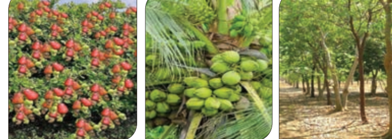
ମୂଲ୍ୟ ବୃଦ୍ଧି ଉପରେ ଜୋର୍ ଦିଆଯିବ, ଯାହା ଗଣ୍ୟ ଓ ଅଣ୍ୟ ବୃଦ୍ଧି କରିବାର ସହାୟକ ହେବ । ସେହିପରି ଉପକୂଳବର୍ତ୍ତୀ ଅଞ୍ଚଳରେ କୋକୋ ଏବଂ କାଳୁ ଚାଷକୁ ଅଧିକ ପ୍ରତିଯୋଗିତାମୂଳକ କରିବାକୁ ନୂତନ ଜ୍ଞାନକୌଶଳର ବ୍ୟବହାର କରାଯିବ । ଏହି ନୂତନ ନୀତି ଦ୍ୱାରା ପାରମ୍ପରିକ ଚାଷ ସହ ଅର୍ଥକରା ପ୍ରସଙ୍ଗକୁ ପ୍ରାଧାନ୍ୟ ମିଳିବ, ଯାହା ଗ୍ରାମୀଣ ଅର୍ଥନୀତିକୁ ସୁଦୃଢ଼ କରିବ ବୋଲି ଅର୍ଥମନ୍ତ୍ରୀ ଆଶା ପ୍ରକାଶ କରିଛନ୍ତି ।

ବଜେଟ୍ରେ ଗଣାମାନଙ୍କ ପାଇଁ ବଡ଼ ଘୋଷଣା କରିଛନ୍ତି ଅର୍ଥମନ୍ତ୍ରୀ ନିର୍ମଳା ସୀତାରମଣ । ଉକ୍ତ ମୂଲ୍ୟର କୃଷିକମାନଙ୍କୁ ଏହା କାଳୁ, ନଡ଼ିଆ ଏବଂ ଚନ୍ଦନ ଚାଷ ଉପରେ ସ୍ୱତନ୍ତ୍ର ଗୁରୁତ୍ୱ ଦେଇଛନ୍ତି ସରକାର । ଅର୍ଥମନ୍ତ୍ରୀ କହିଛନ୍ତି ୨୦୨୩ରୁ ସୁଦ୍ଧା ଭାରତୀୟ କାଳୁ ଓ ନଡ଼ିଆକୁ ବିଶ୍ୱର ଏକ ପ୍ରମୁଖ ଗ୍ରାହକ ଭାବେ ଗଢ଼ିତୋଳିବା ଲକ୍ଷ୍ୟ ରଖାଯାଇଛି । ଏଥିସହିତ କଞ୍ଚାମୂଳ ଉତ୍ପାଦନରେ ଦେଶକୁ ଆଧୁନିକିକରଣ କରିବା ପାଇଁ ସରକାର ଏକ ସମର୍ପିତ କାର୍ଯ୍ୟକ୍ରମ ଆରମ୍ଭ କରିବେ । ଭାରତର ସାମାଜିକ ଓ ସାଂସ୍କୃତିକ ଏହିତ୍ୟ ସହ ଜଡ଼ିତ ଚନ୍ଦନ ଚାଷକୁ ବୃଦ୍ଧି କରିବାକୁ ସରକାର ରାଜ୍ୟମାନଙ୍କ ସହ ସହଭାଗିତ କରିବେ । ଏଥିପାଇଁ ବୈଜ୍ଞାନିକ ଗନ୍ଧ ପ୍ରଶାଳା ଏବଂ ଅମଳ ପରବର୍ତ୍ତୀ ପ୍ରକ୍ରିୟାକରଣ ଉପରେ ଯୋଜନା କରାଯିବ । ସେହିପରି ଶୁଣ୍ଠି ପାଳ ଓ ବାଦ୍ୟମା ଭଳି ପୁରୁଣା ଓ କମ୍ ଅମଳକ୍ଷମ ବଗିଚାଗୁଡ଼ିକର ପୁନରୁଦ୍ଧାର କରାଯିବ । ଅଞ୍ଚଳରେ, ଆଲମ୍ବ ଏବଂ ପାଇଁ ନରସିଂହ ଗନ୍ଧ ପାଇଁ ସରକାରୀ ସହାୟତା ପ୍ରଦାନ କରାଯିବ । ଏହି ଯୋଜନାଗୁଡ଼ିକରେ ଗ୍ରାମୀଣ ଯୁବକମାନଙ୍କୁ ସାମିଲ କରାଯାଏ ।