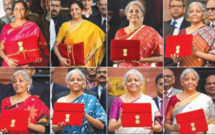
ଏଥର ତାମିଲନାଡୁର ପ୍ରସିଦ୍ଧ କାଞ୍ଜିଭରମ୍ ଶାଢ଼ୀ ପିନ୍ଧି ବଜେଟ୍ ଉପସ୍ଥାପନ କରିବାକୁ ଲୋକସଭାରେ ପହଞ୍ଚିଥିଲେ ନିର୍ମଳା ସୀତାରମଣ । ଏପରି କରି ସେ ତାଙ୍କ ଗୃହ ରାଜ୍ୟ ତାମିଲନାଡୁର ପ୍ରାଚୀନ ବୟନ କଳାକୁ ସମ୍ମାନ ଜଣାଇଛନ୍ତି । ଏଥର, ତେ ହାଲୁକା ସୁନେଲି ବାଦ୍ୟମା ଟେକ୍ କାଙ୍ଗ୍ ସହିତ ଏକ ବାଲଗଣା ହାତବୁଣା କଙ୍ଗ୍ କାଞ୍ଜିଭରମ୍ ଶାଢ଼ୀ ଓ କପି ବାଦ୍ୟମା ବର୍ତ୍ତରରେ ସୂତା କାମ ହୋଇଥିବା

୨୦୨୨-୨୩ ଅର୍ଥକ ବର୍ଷ ପାଇଁ କେନ୍ଦ୍ରୀୟ ବଜେଟ୍ରେ ଅରେଞ୍ଜି ଇକୋନୋମିକୁ କେନ୍ଦ୍ର ସରକାର ପ୍ରାଧାନ୍ୟ ଦେଇଛନ୍ତି । ଅରେଞ୍ଜି ଅର୍ଥନୀତି ବା ସ୍ୱଳ୍ପକର୍ମାଣ୍ଡ ଅର୍ଥନୀତି, ସ୍ୱଳ୍ପକର୍ମାଣ୍ଡ, ଏସ୍‌ଟି ଏବଂ ବୌଦ୍ଧିକ ସମ୍ପତ୍ତି ଦ୍ୱାରା ପରିଚାଳିତ କ୍ଷେତ୍ରଗୁଡ଼ିକୁ ଦୃଷ୍ଟିଏ, ଯେଉଁଠାରେ ମୂଲ୍ୟ ପାରମ୍ପରିକ ଉତ୍ପାଦନ ପରିବର୍ତ୍ତେ ଚିନ୍ତାଧାରା ଏବଂ ଜ୍ଞାନରୁ ଉତ୍ପନ୍ନ ହୋଇଥାଏ । ଏହା ଆନିମେସନ୍, ଗେମିଂ, ଫିଲ୍ମ, ସଙ୍ଗୀତ, ଭିଡିଓ ଆଲିଭିଂ, ଡିଜିଟାଲ୍, ଡିଜିଟାଲ୍ ବିଷୟଗୁଡ଼ି ଏବଂ କମ୍ପ୍ୟୁଟିଂ-ଏଡିଟିଂ ଭଳି କ୍ଷେତ୍ରଗୁଡ଼ିକୁ ଅନ୍ତର୍ଭୁକ୍ତ କରେ । ଏହା ନିମ୍ନଲିଖିତ ସୃଷ୍ଟି, ସ୍ଥାୟୀ ବିକାଶ ଏବଂ ସାମ୍ପ୍ରତିକ, ସାମାଜିକ ଏବଂ ଅର୍ଥକ ଅଭିବୃଦ୍ଧି ପାଇଁ ଏକ ପ୍ରମୁଖ ବାହକ ଭାବରେ କାର୍ଯ୍ୟ କରେ । ସୀତାରମଣ ଘୋଷଣା କରିଛନ୍ତି ସରକାର ଆଇଆଇଆଇଟି ମୁଖ୍ୟତଃ ପ୍ରୋତ୍ସାହନ ଦେବେ । ସ୍କୁଲ/କଲେଜରେ କମ୍ପ୍ୟୁଟିଂ ଲ୍ୟାବ୍ ରହିବ । ୧୫ ଶହ ସେକେଣ୍ଡାରୁ ସ୍କୁଲ, ୫ ଶହ କଲେଜରେ ଏଡିଟିଭି ସ୍ଥାପନ ହେବ । ୨୦୨୩ ମସିହା ସୁଦ୍ଧା ଏଡିଟିଭି କ୍ଷେତ୍ରରେ ୨୦ ଲକ୍ଷ ଦକ୍ଷ ପ୍ରୋଗ୍ରାମର ପୁରଣ ଲକ୍ଷ୍ୟ ହେବ । ସ୍ଥାନୀୟ ପ୍ରତିଭାକୁ ପୋଷଣ ସହ ଦେଶୀୟ ବୌଦ୍ଧିକ ସମ୍ପଦ ସୃଷ୍ଟି ହେବ ।