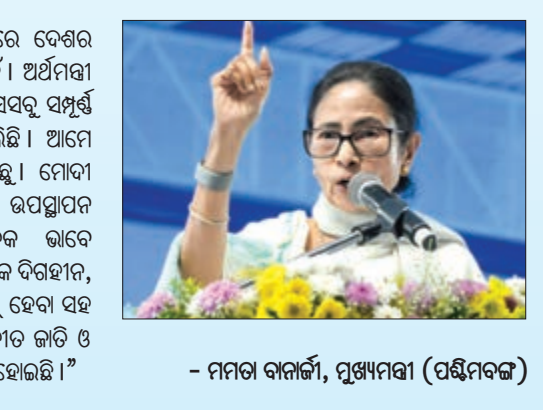
- ମମତା ବାନାର୍ଜୀ, ମୁଖ୍ୟମନ୍ତ୍ରୀ (ପଶ୍ଚିମବଙ୍ଗ)

“ଏହା ଏକ ବିଶିଷ୍ଟ ବଜେଟ୍ । ଏଥିରେ ଦେଶର ସାଧାରଣ ନାଗରିକଙ୍କ ପାଇଁ କିଛି ବି ନାହିଁ । ଅର୍ଥମନ୍ତ୍ରୀ ଗୀତି କରିବାର କଥା ଯାହା ବି କହିଛନ୍ତି ସେସବୁ ସମ୍ପୂର୍ଣ୍ଣ ମିଛ । ଏହି ପ୍ରକଳ୍ପଗୁଡ଼ିକ ପୂର୍ବରୁ ଚାଲିଛି । ଆମେ ସେଗୁଡ଼ିକ ଉପରେ କାମ ଆରମ୍ଭ କରିଛୁ । ମୋଦୀ ସରକାର ଏକ ହମ୍ପଟି ଡମ୍ପଟି ବଜେଟ୍ ଉପସ୍ଥାପନ କରିଛନ୍ତି । ବଜେଟ୍ରେ ଉଦ୍ଦେଶ୍ୟମୂଳକ ଭାବେ ପର୍ଯ୍ୟଟନକୁ ଶେଷ କରାଯାଇଛି । ଏହା ଏକ ଦିଗଦାନ, ଦୂରଦୃଷ୍ଟିହୀନ ଏବଂ ଜନବିରୋଧୀ ବଜେଟ୍ ହେବା ସହ ଏହା ମହିଳା, କୃଷକ,ଶିକ୍ଷା ଏବଂ ଅନୁସୂଚୀତ ଜାତି ଓ ଜନଜାତି ବିରୋଧୀ ବୋଲି ମଧ୍ୟ ପ୍ରମାଣିତ ହୋଇଛି ।”