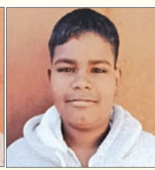
ପ୍ରେମିକ ଓ ଅନ୍ୟ ଜଣେ ବନ୍ଧୁଙ୍କ ସହାୟତାରେ ଏହି ବିଭାଜନ ନକ୍ସା ପ୍ରସ୍ତୁତ କରିଥିଲେ।

ଝୁଟି ଯୋଗେ ନେଇ କେନାଲରେ ଫିଙ୍ଗି ଦିଆଯାଇଥିଲା। ଘଟଣାକୁ ଚଢ଼ାଇବା ପାଇଁ ମିଛ ନିବେଦନ ନାଟକ ରଚନା କରାଯାଇଥିଲା।