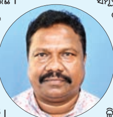
ରାଜ୍ୟରେ ଥିବା ୧୧୨୦ ପଞ୍ଚାୟତର ପାନୀୟ ଜଳ ଯୋଗାଣ ସମ୍ପୂର୍ଣ୍ଣ ହୋଇଛି।

ଭୁବନେଶ୍ଵର, ୨୫/୧/୨୪-ଏନ୍‌ଏନ୍‌ଏ: ରାଜ୍ୟରେ ଥିବା ୧୧୨୦ ପଞ୍ଚାୟତ ପାଇଁ ପାନୀୟ ଜଳ ଯୋଗାଣ ସମ୍ପୂର୍ଣ୍ଣ ହୋଇଛି। ରାଜ୍ୟରେ ଥିବା ୧୧୨୦ ପଞ୍ଚାୟତର ପାନୀୟ ଜଳ ଯୋଗାଣ ସମ୍ପୂର୍ଣ୍ଣ ହୋଇଛି।