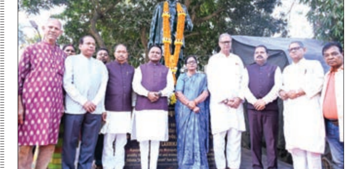
କାନ୍ଧକବି ଲକ୍ଷ୍ମୀକାନ୍ତ ମହାପାତ୍ରଙ୍କ ଶ୍ରାଦ୍ଧଦିବସ