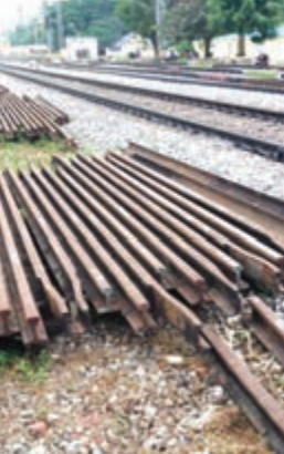
କାର୍ଯ୍ୟର ପ୍ରତିଫଳନ । ଷୋର୍ସ ବିଭାଗ ଏହି ପଦକ୍ଷେପକୁ ସମର୍ଥନ କରି ସଫଳତାର ସହ ପୂର୍ବତନ ରେଳପଥର ବିକ୍ରୟକୁ ତ୍ୱରାନ୍ୱିତ କରିବା ପାଇଁ ପୂର୍ବତନ ରେଳବାଇ ୨୦୧୩ ମସିହାରୁ ଏହାର ସମର୍ଥନ ଭାରତୀୟ ରେଳବାଇ ଇ-ପ୍ରୋକ୍ୟୁରମେଣ୍ଟ୍ ସିଷ୍ଟମ (ଆଇଆରଇପିଏସ୍) ପୋର୍ଟାଲ୍ ମାଧ୍ୟମରେ ଇ-ନିଲମ ପରିଚାଳନା କରୁଛି । ଏହି ପୋର୍ଟାଲରେ ୮୯୦୦ରୁ ଅଧିକ ଆବୃତ୍ତ ବିକ୍ରେତା ଥିବା ନିଲମ ପ୍ରକ୍ରିୟା ସ୍ୱଳ୍ପ, ପ୍ରତିଫଳନାମୂଳକ ଓ କାର୍ଯ୍ୟକ୍ଷମ ଭାବେ ସମ୍ପନ୍ନ ହେଉଛି । ଏହି ସଫଳତା ଭାରତୀୟ ରେଳବାଇର ବ୍ୟାପକ ଉଦ୍ଦେଶ୍ୟ ଏବଂ ଜାତୀୟ ଭିତ୍ତିଭୂମି ଅଭିବୃଦ୍ଧିକୁ ସମର୍ଥନ କରିବାର ପୂର୍ବତନ ରେଳବାଇର ଉତ୍କର୍ଷତା ଏବଂ ସାମୂହିକ କାର୍ଯ୍ୟ ବକ୍ଷତା ପ୍ରତିଫଳନାକୁ ପ୍ରତିଫଳିତ କରୁଛି ।

ଭୁବନେଶ୍ୱର, ୨୫/୨/୨୨-ଏନ୍-ଏନ୍-ଏ: ପୂର୍ବତନ ରେଳପଥ ନିର୍ଦ୍ଧାରିତ ସମୟ ପୂର୍ବରୁ ରେଳବାଇ ବୋର୍ଡର ଷ୍ଟାମ୍ପ ବିକ୍ରୟ ଲକ୍ଷ୍ୟକୁ ସଫଳତାର ସହ ଅତିକ୍ରମ କରି ଏକ ଗୁରୁତ୍ୱପୂର୍ଣ୍ଣ ମାଇଲଷ୍ଟେକ୍ ହାସଲ କରିଛି । ୨୦ ଫେବୃଆରୀ ୨୦୨୨ ସୁଦ୍ଧା ପୂର୍ବତନ ରେଳପଥ ମୋଟ ୨୬୦.୦୨ କୋଟି ଷ୍ଟାମ୍ପ ବିକ୍ରୟ କରି ରେକର୍ଡ କରିଛି, ଯାହା ୪୦ ଦିନ ପୂର୍ବରୁ ଏହି ଲକ୍ଷ୍ୟକୁ ଅତିକ୍ରମ କରିଛି ।