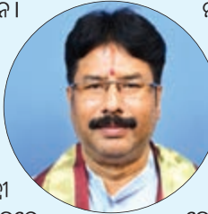
ବିଧାନସଭାରେ ଏହି ସୂଚନା ଦେଇଛନ୍ତି ନଗର ଉନ୍ନୟନ ମନ୍ତ୍ରୀ କୁଞ୍ଜବିହାରୀ ମହାପାତ୍ର।

ଭୁବନେଶ୍ଵର, ୨୫/୧/୨୪-ଏନ୍‌ଏନ୍‌ଏ: ରାଜ୍ୟରେ ଆମ ବସ୍ ଦୁର୍ଘଟଣା: ଦ୍ଵିତୀୟରେ ଯାଇଛି ୭ ଜୀବନ। ରାଜ୍ୟରେ ଭୁବନେଶ୍ଵରରେ ୭ ଜୀବନ ଯାଇଥିବାବେଳେ କଟକରେ ପଦକ୍ଷେପ ନେଇଛନ୍ତି। ବର୍ଷକ ଯାଇଛି ଜଣକର ଜୀବନ।