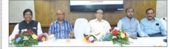
ଭୁବନେଶ୍ଵର, ୨୫/୧/୨୪-ଏନ୍‌ଏନ୍‌ଏ: ଆଲୋଚନା କରିଥିଲେ। ଏହି ବିଶେଷ କର୍ମଗାରୀ ରାଜ୍ୟ ବାମା ନିଗମ ପ୍ରାୟତଃ, ଆଞ୍ଚଳିକ କାର୍ଯ୍ୟାଳୟ, ଓଡ଼ିଶା ଏହାର ୭୫ତମ ପ୍ରତିଷ୍ଠା ଦିବସ (ପୁରୀନମ ଜୟନ୍ତୀ) ପାଳିତ ହୋଇଯାଇଛି।