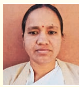
ଯୁବତୀ ଜଣକ ସ୍ଥାନୀୟ ଜଣେ ଯୁବକଙ୍କ ସହ ପ୍ରେମ ସମ୍ପର୍କ ରଖୁଥିଲେ, ଯାହାକୁ ତାଙ୍କ ମା' ଓ ଭାଇ ଦୃଢ଼ ବିରୋଧ କରି ଆସୁଥିଲେ।

ଭୁବନେଶ୍ଵର, ୨୫/୧/୨୪-ଏନ୍‌ଏନ୍‌ଏ: ପ୍ରେମ ପାଇଁ ରକ୍ତମୁଖା ସାଜିଲା ଝିଅ। ନିଜ ପ୍ରେମିକ ସହ ମିଶି ଜଳକ୍ରୀଡ଼ା ମା' ଓ ସାନ ଭାଇଙ୍କୁ ହତ୍ୟା କରିବା ଭଳି ଏକ ଗଠାଣୀକର ଘଟଣା କୋରାପୁଟ ଜିଲ୍ଲା ବୋରିଗୁଣ୍ଡା ଅଞ୍ଚଳରେ ଦେଖିବାକୁ ମିଳିଛି।