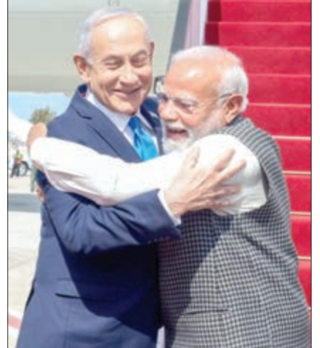
ଇସ୍ରାଏଲ୍ ଗଣ୍ଠରେ ଯାଉଥିବା ପ୍ରଧାନମନ୍ତ୍ରୀ ନରେନ୍ଦ୍ର ମୋଦୀଙ୍କୁ ଇସ୍ରାଏଲ୍ ପ୍ରଧାନମନ୍ତ୍ରୀ ବେଞ୍ଜାମିନ୍ ନେତାନ୍ୟାହୁ ନେତାବଦ୍ଧରେ ସ୍ଵାଗତ କରୁଛନ୍ତି ।

ପ୍ରଧାନମନ୍ତ୍ରୀ ନରେନ୍ଦ୍ର ମୋଦୀ ରୁଧିର ଦିନ ଠାରୁ ଦୁଇ ଦିନିଆ ଇସ୍ରାଏଲ୍ ଗଣ୍ଠରେ ଯାଉଥିବା ପ୍ରଧାନମନ୍ତ୍ରୀ ବେଞ୍ଜାମିନ୍ ନେତାନ୍ୟାହୁ ଏବଂ ତାଙ୍କ ପତ୍ନୀ ସାରା ନେତାନ୍ୟାହୁ ବେନ ଗୁରିଅର୍ ଇସ୍ରାଏଲ୍ ସମରାଞ୍ଚନା କିମ୍ପାନବଦ୍ଧରେ ଉପସ୍ଥିତ ରହି ପ୍ରଧାନମନ୍ତ୍ରୀ ମୋଦୀଙ୍କୁ ସ୍ଵାଗତ କରିଥିଲେ । ପରେ ଏହି ବିମାନବଦ୍ଧରେ ହିଁ ସ୍ଵତନ୍ତ୍ର ଭାବେ ବ୍ୟବସ୍ଥିତ ରୁମ୍ରେ ନେତାନ୍ୟାହୁ ଏବଂ ମୋଦୀ ବ୍ୟକ୍ତିଗତ ଆଲୋଚନା କରିଥିଲେ । ଏହି ସମୟରେ ସାରା ନେତାନ୍ୟାହୁ ମଧ୍ୟ ଉପସ୍ଥିତ ଥିଲେ । ମୋଦୀଙ୍କ ସ୍ଵାଗତ ପାଇଁ ବିମାନବଦ୍ଧରେ ମୋଦୀଙ୍କ ଯିବା ରାଷ୍ଟ୍ରଗୁଡ଼ିକରେ ତ୍ରିରଙ୍ଗା ପତାକା ଲଗାଯାଇଥିବା ଦେଖିବାକୁ ମିଳିଛି । ଏଠାରୁ ମୋଦୀଙ୍କ ପାଇଁ ବ୍ୟବସ୍ଥା କରାଯାଇଥିବା ହୋଟେଲକୁ ପ୍ରଧାନମନ୍ତ୍ରୀ ମୋଦୀ ଯାଇଥିଲେ ଯେଉଁଠାରେ ତାଙ୍କୁ ପ୍ରବନ୍ଧୀ ଭାରତୀୟମାନେ ପାରମ୍ପରିକ ନୃତ୍ୟ ସଂଗୀତ ପରିବେଷଣ ପୂର୍ବକ ସ୍ଵାଗତ କରିଥିଲେ । ପରେ ମୋଦୀ ଇସ୍ରାଏଲ୍ ସଂସଦ 'ନେସେଟ୍'କୁ ସେଥିପ୍ରତି କହିଛନ୍ତି । ନେସେଟ୍ ସମ୍ବେଦନା କରିବା ପରିପ୍ରେକ୍ଷାରେ ମୋଦୀ, ଇସ୍ରାଏଲ୍ ଉପରେ ହମାସ୍ ଆକ୍ରମଣକୁ ତୀବ୍ର ନିନ୍ଦା କରିଥିଲେ । ମୋଦୀ ଇସ୍ରାଏଲ୍ ସମରାଞ୍ଚନା ସମ୍ବେଦନା କରି କହିଥିଲେ ଯେ, ଆମେ ମୋଦୀଙ୍କ ସହ ଉପସ୍ଥିତ ରହିବାକୁ ଦୀର୍ଘ ସମୟ ଧରି ଆତଙ୍କବାଦର ଶିକାର ହୋଇଆସୁଛି । >>>