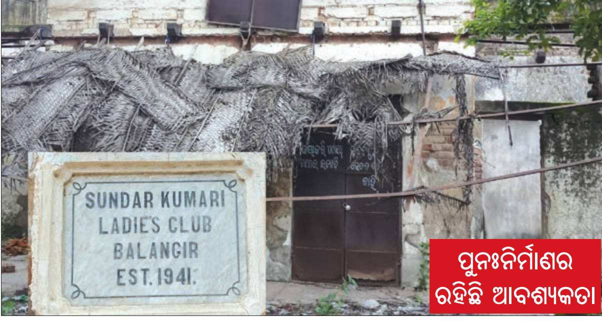
ପୁନଃନିର୍ମାଣର ହିଁ ଆବଶ୍ୟକତା

ବଲାଙ୍ଗୀର,୭ମ/ଏନ୍-ଏନ୍-ଏ: ସମ୍ପ୍ରତି ସମାଜରେ ନାରୀଙ୍କୁ ଅଧିକ ଅଧିକାର ଦେଇ ସ୍ୱାଧୀନତା ଦେବା ଆବଶ୍ୟକତା ଅଧିକ ହେଉଛି । ନାରୀଙ୍କୁ ଭାବର ଆଦାନପ୍ରଦାନ ତଥା ଅବସର ବିନୋଦନ ପାଇଁ କେତେକ ସ୍ଥଳେ ଲେଡିଜ୍ କ୍ଲବ୍ ଓ ନାରୀ ସେବା ସଦନ ଭଳି ଅନୁଷ୍ଠାନର ସଂଗଠନ ଆବଶ୍ୟକତା ରହିଛି । କିନ୍ତୁ ଆଜି ୧୯୪୧ ମସିହାରେ ବଲାଙ୍ଗୀର ସହରର ନାରୀଙ୍କ ଜାଗରଣ ପାଇଁ ସ୍ଥାପିତ 'ସୁନ୍ଦର କୁମାରୀ ଲେଡିଜ୍ କ୍ଲବ୍'ର ଅସ୍ତିତ୍ୱ ହଜିଯାଇଛି । ବଲାଙ୍ଗୀରର ପୁରୁଣା ରାଜବାଟିର ଏକ ଅଂଶରେ ଥିବା ବର୍ତ୍ତମାନ ଗୋପାଳନା ମନ୍ଦିରର ପୁନଃରୁଦ୍ଧାର ବେଳେ ଏହି ଶତାୟୁ ଅନୁଷ୍ଠାନକୁ ଭଙ୍ଗିଦେଇ ରୂରମାର୍ କରାଯାଇଥିଲା । ମାର୍ଚ୍ଚ ୮ ତାରିଖ ମହିଳା ଦିବସ ଅବସରରେ ଜିଲ୍ଲା ପ୍ରଶାସନ ତଥା ନେତାଜୀମାନେ ଅନେକ ଭାଷଣ ଦେବେ । କିନ୍ତୁ ନାରୀଙ୍କ ସଚେତନତା ପାଇଁ ଥିବା ଏକ ଅନୁଷ୍ଠାନକୁ ଭଙ୍ଗି ଦିଆଗଲା ପରେ ମଧ୍ୟ କେହି ସ୍ୱର ଉତ୍ତୋଳନ କରୁନାହାନ୍ତି । ପାଟଣା ଇତିହାସକୁ ଜଣାଯାଏ ଯେ ସ୍ୱାଧୀନତା ପୂର୍ବରୁ ପାଟଣା ଗଡ଼ଜାତ ରାଜ୍ୟରେ ଚୈତ୍ୟାବଳୀ ଶାଳାମାନେ ଶାସନ କଲାବେଳେ ଅନେକ ଉନ୍ନତମୂଳକ କାମ କରାଇଥିଲେ । ସେସମୟରେ ନାରୀ ସମାଜ ସେତେବେଳେ ଶିକ୍ଷିତ ହୋଇଥିଲା ଓ ସବୁ ଗୋଟି କାଢ଼ି ବାହାରକୁ ବାହାରିଥିଲା । ସେଥିପାଇଁ ନାରୀ ସଚେତନତା ଲାଗି ସୁନ୍ଦର କୁମାରୀ ଲେଡିଜ୍ କ୍ଲବ୍ ସ୍ଥାପନ କରି ଅବସର ବିନୋଦନ ପାଇଁ ସୁଯୋଗ ଦିଆଯାଇଥିଲା । ନାରୀ ଶିକ୍ଷା ଓ ସଚେତନତାରେ ଯେ ସମାଜର ମଙ୍ଗଳ ହେବ ତାହା ସେ ସମୟରେ ଉପଲବ୍ଧି କରିଥିଲେ । ସେହି ସମୟରେ ଏଠାରେ ମହିଳାମାନେ ଏକତ୍ର ହୋଇ ଭାବର ଆଦାନପ୍ରଦାନ କରିବା ସହ ଅନେକ ଖେଳ ପ୍ରତିଯୋଗିତା ମଧ୍ୟ ହେଉଥିଲା କୁହାଯାଏ । ଏଠାରେ ଅନେକ ନାଟକ ମଧ୍ୟ ମଞ୍ଚସ୍ଥ ହୋଇଥିଲା ଓ ମହିଳା ଅଭିନେତ୍ରୀ ଏଠାରୁ ସୃଷ୍ଟି ହୋଇଥିଲେ । ୧୯୪୮ ମସିହାରେ ପାଟଣାଗଡ଼ ଜାତୀୟ ମିଶ୍ରଣ ପରେ ଏହା ଓଡ଼ିଶା ସରକାରଙ୍କ ହାତକୁ ଚାଲିଗଲା । ପରେ ଦେବୋତ୍ତର ବିଭାଗ ଅଧୀନରେ