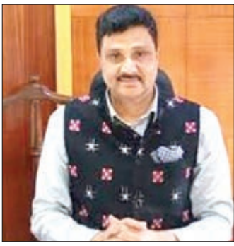
ପରିବାରକୁ ୧୫ ମେ ୨୦୨୬ ମଧ୍ୟରେ ସର୍ବୋଚ୍ଚ ମାଧ୍ୟମରେ ଡିମ୍ବ୍ କର 'ବସୁନ୍ଦରା' ଯୋଜନା ଅନ୍ତର୍ଗତ ଭୂମି ପ୍ରଦାନ ଓ ଜମିପତ୍ର

ଭୁବନେଶ୍ୱର, ୯/୪/୨୦୨୬: ଉଡ଼ିଶା ସରକାରଙ୍କ ରାଜସ୍ୱ ଓ ବିପର୍ଯ୍ୟୟ ପରିଚାଳନା ବୈଠକ ଅନୁଷ୍ଠିତ ହୋଇଥିଲା ।