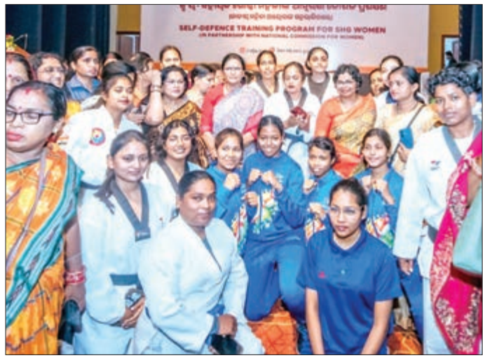
ରାଜ୍ୟର ମହିଳାମାନେ ଆତ୍ମରକ୍ଷା ପ୍ରଶିକ୍ଷଣ କ୍ରମରେ ଅଂଶଗ୍ରହଣ କରିବା ପାଇଁ ସଜାଜ ହୋଇଛନ୍ତି । ଏହି କାର୍ଯ୍ୟକ୍ରମରେ ମିଶନ ଶକ୍ତି ବିଭାଗର ମିଳିତ ସହଯୋଗରେ ପ୍ରଥମ ଥର ପାଇଁ ଆରମ୍ଭ ହୋଇଥିବା ଏହି ଆତ୍ମରକ୍ଷା ପ୍ରଥମ ପର୍ଯ୍ୟାୟରେ ରାଜ୍ୟର ୫ଟି ଜିଲ୍ଲା ପର୍ଯ୍ୟନ୍ତ ଗୋଷ୍ଠୀ, କଟକ, ପୁରୀ, କେନ୍ଦୁଝର ଏବଂ ଗଞ୍ଜାମର ୫,୦୦୦ ଏସ୍ଏଚ୍‌ଜି ସଦସ୍ୟାଙ୍କୁ ପ୍ରଶିକ୍ଷଣ ଦିଆଯିବ ।

ଭୁବନେଶ୍ୱର, ୯/୪/୨୦୨୬: ରାଜ୍ୟର ମହିଳା ସ୍ୱୟଂ ସହାୟକ ଗୋଷ୍ଠୀ (ଏସ୍ଏଚ୍‌ଜି) ର ସଦସ୍ୟାମାନଙ୍କୁ ପ୍ରଶିକ୍ଷିତ ଓ ସଶକ୍ତ କରିବା ଲକ୍ଷ୍ୟରେ ଉପମୁଖ୍ୟମନ୍ତ୍ରୀ ତଥା ମହିଳା ଓ ଶିଶୁ ବିକାଶ, ମିଶନ ଶକ୍ତି ଏବଂ ପର୍ଯ୍ୟଟନ ମନ୍ତ୍ରୀ ପ୍ରଭାତୀ ପରିଡ଼ା ଆଜି ଭୁବନେଶ୍ୱରସ୍ଥିତ ମିଶନ ଶକ୍ତି ଭବନରେ ରାଜ୍ୟର ମହିଳା ସ୍ୱୟଂ ସହାୟକ ଗୋଷ୍ଠୀ (ଏସ୍ଏଚ୍‌ଜି) ର ସଦସ୍ୟାମାନଙ୍କୁ ପ୍ରଶିକ୍ଷିତ ଓ ସଶକ୍ତ କରିବା ଲକ୍ଷ୍ୟରେ ମିଶନ ଶକ୍ତି ପସରା ପ୍ରଥମ ଥର ପାଇଁ ଏକ ସ୍ୱତନ୍ତ୍ର ଆତ୍ମରକ୍ଷା ପ୍ରଶିକ୍ଷଣ କାର୍ଯ୍ୟକ୍ରମର ଶୁଭାରମ୍ଭ କରିଛନ୍ତି ।