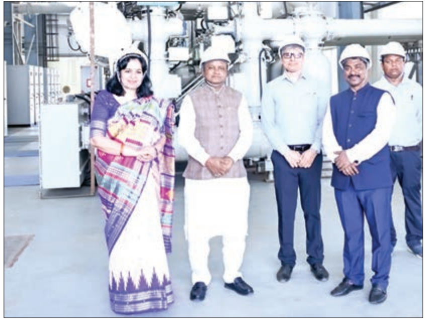
ବାଳିଆଛା ଠାରେ ନୂତନ ଗ୍ରୀଡ଼ ସର୍ବସ୍ୱେଚ୍ଛା ଓ ପ୍ରାକୃତିକ ଲାଲନ୍ ଉଦ୍‌ଘାଟନ କାର୍ଯ୍ୟକ୍ରମରେ ମୁଖ୍ୟମନ୍ତ୍ରୀ ମୋହନ ଚରଣ ମାଝୀ ଓ ଅନ୍ୟମାନେ

ଜଣାଇଥିଲେ । ଏହି କାର୍ଯ୍ୟକ୍ରମରେ କିଏ ଭୁବନେଶ୍ୱର କ୍ୟାମ୍ପସ୍ ସମେତ ବଲାଙ୍ଗୀର, କଳହାଣ୍ଡି, ବାରିପଦା ଓ ବାଲେଶ୍ୱର ଆଦି କ୍ୟାମ୍ପସ୍ରେ ଛାତ୍ରଛାତ୍ରୀ ସାମିଲ ହୋଇଥିଲେ ।