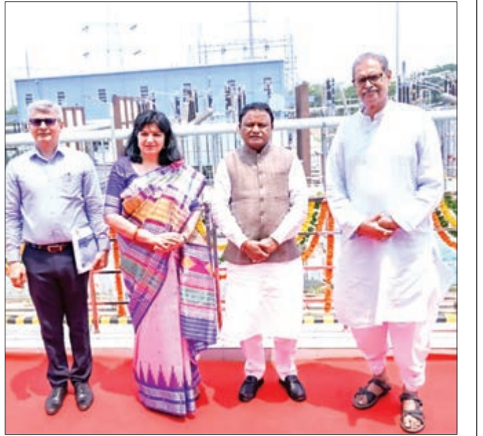
ବାଳିଆଛା ଠାରେ ନୂତନ ଗ୍ରୀଡ଼ ସର୍ବସ୍ୱେଚ୍ଛା ଓ ପ୍ରାକୃତିକ ଲାଲନ୍ ଉଦ୍‌ଘାଟନ କାର୍ଯ୍ୟକ୍ରମରେ ମୁଖ୍ୟମନ୍ତ୍ରୀ ମୋହନ ଚରଣ ମାଝୀ ଓ ଅନ୍ୟମାନେ