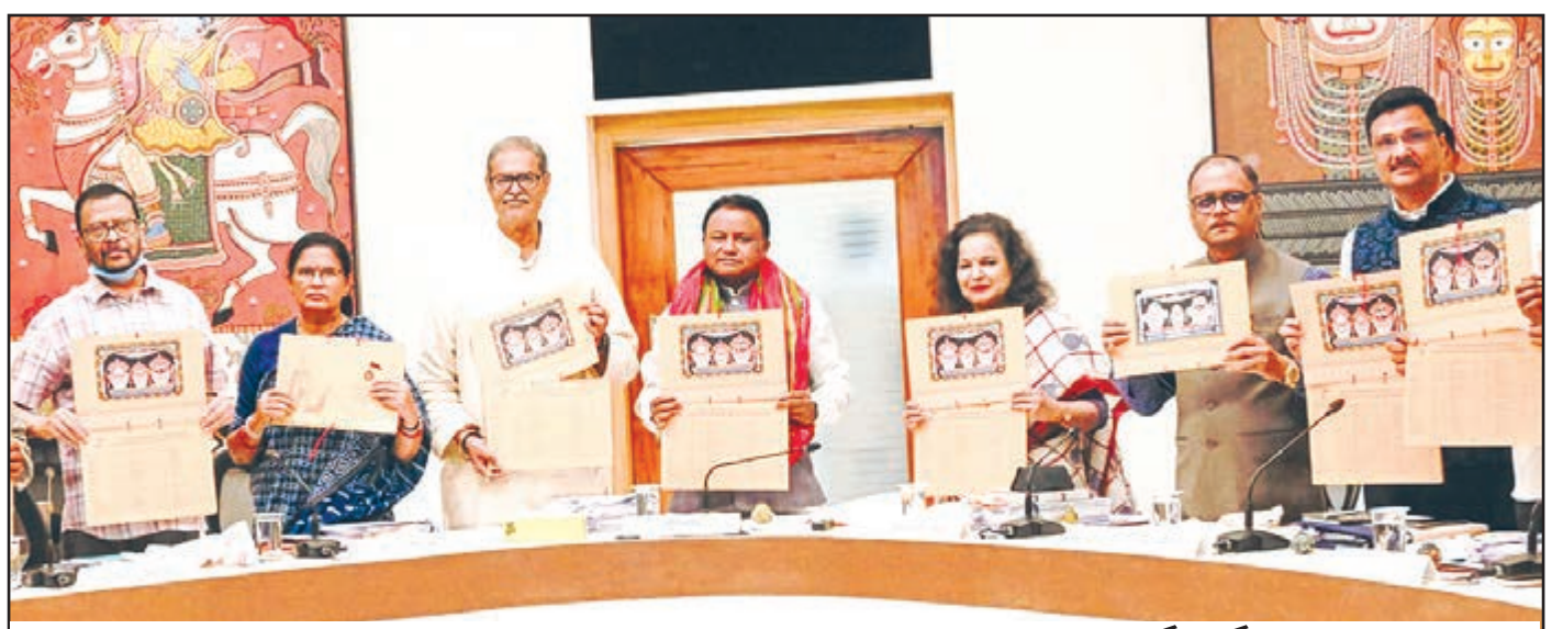
ଶ୍ରୀମନ୍ଦିର ପ୍ରଶାସନ ପକ୍ଷରୁ ପ୍ରକାଶିତ 'ଶ୍ରୀଜୀଉଙ୍କ ଯାଦିଯାତ୍ରା ଓ ପର୍ବପର୍ବାଣି' କ୍ୟାଲେଣ୍ଡର ଲୋକାର୍ପଣ ଅବସରରେ ମୁଖ୍ୟମନ୍ତ୍ରୀ ମୋହନ ଚରଣ ମାଝୀ ଓ ଅନ୍ୟମାନେ ।