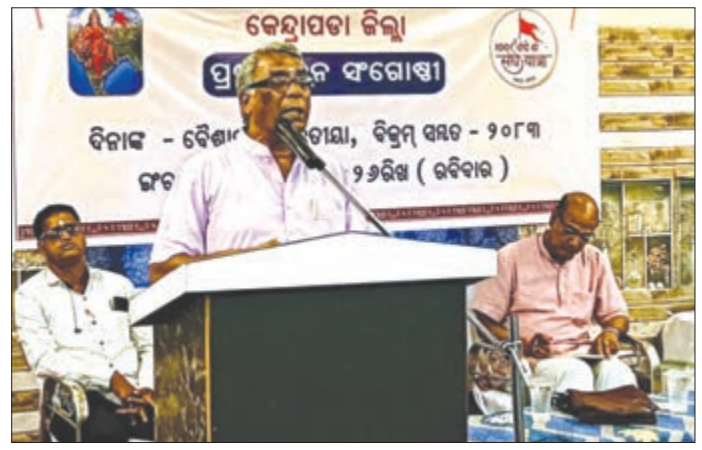
କେନ୍ଦ୍ରାପଡ଼ା, ଖାଉଟି ଗ୍ରାମରେ ଭାରତୀୟ ସମାଜନ ସଂସ୍କୃତି ଶାଶ୍ୱତ ଓ ଚିରନ୍ତନ ହେବ ।

ଭାରତୀୟ ସମାଜନ ସଂସ୍କୃତି ଶାଶ୍ୱତ ଓ ଚିରନ୍ତନ ହେବ । ଲୋକମାନେ ଏହାକୁ ଗୁଣାଣି ଶିବିର ଭାବେ ଗ୍ରହଣ କରୁଛନ୍ତି ।