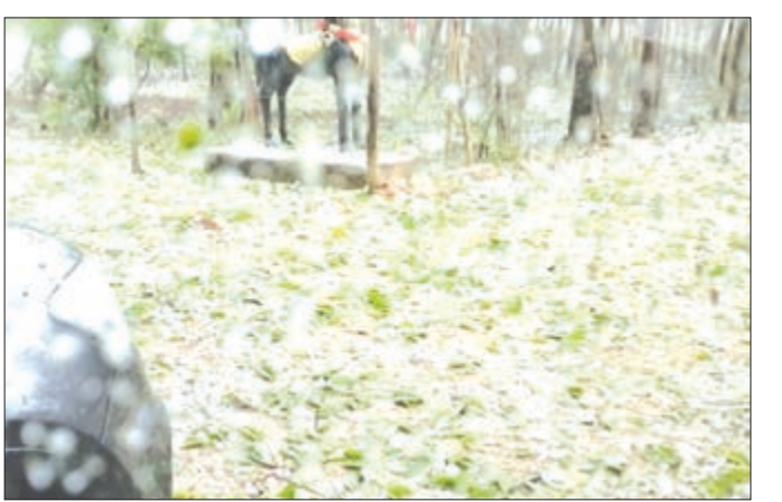
କାଳବୈଶାଖୀର ତାଣ୍ଡବ, କୁଆପଥର ମାଡ଼ରେ ବ୍ୟାପକ କ୍ଷତି ହୋଇଛି ।

କାଳବୈଶାଖୀର ତାଣ୍ଡବ, କୁଆପଥର ମାଡ଼ରେ ବ୍ୟାପକ କ୍ଷତି ହୋଇଛି । ଲୋକମାନେ ଏହାକୁ ଗୁଣାଣି ଶିବିର ଭାବେ ଗ୍ରହଣ କରୁଛନ୍ତି ।