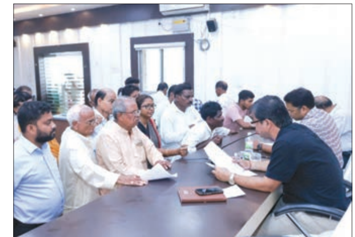
ଯୁଗ୍ମ ଜନଅଭିଯୋଗ ଶୁଣାଣି ଶିବିର ଆରମ୍ଭ ହୋଇଛି ।

ଯୁଗ୍ମ ଜନଅଭିଯୋଗ ଶୁଣାଣି ଶିବିର ଆରମ୍ଭ ହୋଇଛି । ଲୋକମାନେ ଏହାକୁ ଗୁଣାଣି ଶିବିର ଭାବେ ଗ୍ରହଣ କରୁଛନ୍ତି ।