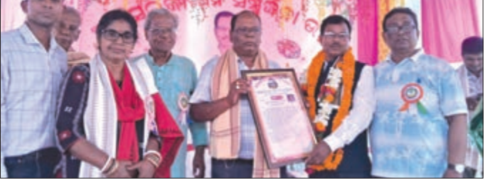
ପ୍ରଧାନଶିକ୍ଷକଙ୍କୁ ବିଦାୟକାଳୀନ ସମ୍ବର୍ଦ୍ଧନା ହେଉଛି ।

ପ୍ରଧାନଶିକ୍ଷକଙ୍କୁ ବିଦାୟକାଳୀନ ସମ୍ବର୍ଦ୍ଧନା ହେଉଛି । ଲୋକମାନେ ଏହାକୁ ଗୁଣାଣି ଶିବିର ଭାବେ ଗ୍ରହଣ କରୁଛନ୍ତି ।