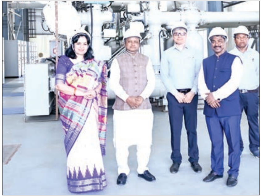
ବାଳିଆ ଠାରେ ନୂତନ ଗ୍ରୀଡ଼ ସର୍ବସ୍ୱେଚ୍ଛା ଓ ପ୍ରାକୃତିକ ଲାଭ ଉଦ୍‌ଘାଟନ କାର୍ଯ୍ୟକ୍ରମରେ ମୁଖ୍ୟମନ୍ତ୍ରୀ ମୋହନ ଚରଣ ମାଝୀ ଓ ଅନ୍ୟମାନେ

ଜଣାଇଥିଲେ । ଏହି କାର୍ଯ୍ୟକ୍ରମରେ କିଏ ଭୁବନେଶ୍ୱର କ୍ୟାମ୍ପସ୍ ସମେତ ବଲାଙ୍ଗୀର, କଳାହାଣ୍ଡି, ବାରିପଦା ଓ ବାଲେଶ୍ୱର ଆଦି କ୍ୟାମ୍ପସ୍‌ରେ ଛାତ୍ରଛାତ୍ରୀ ସାମିଲ ହୋଇଥିଲେ ।