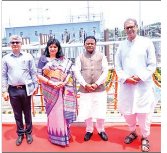
ବାଳିଆ ଠାରେ ନୂତନ ଗ୍ରୀଡ଼ ସର୍ବସ୍ୱେଚ୍ଛା ଓ ପ୍ରାକୃତିକ ଲାଭ ଉଦ୍‌ଘାଟନ କାର୍ଯ୍ୟକ୍ରମରେ ମୁଖ୍ୟମନ୍ତ୍ରୀ ମୋହନ ଚରଣ ମାଝୀ ଓ ଅନ୍ୟମାନେ