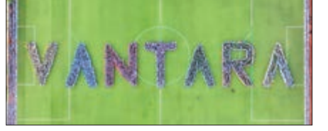
'ବନତାରା' ଲୋଗୋ ଦ୍ୱାରା ଅନୁପ୍ରାଣିତ ମାନବ ଅକ୍ଷର ଗଠନ

ଭୁବନେଶ୍ୱର, ୯/୪/୨୦୨୬: ନିଜ ଜନ୍ମଦିନରେ କିଏ ଛାତ୍ରଛାତ୍ରୀଙ୍କ ପାଇଁ ଛାତ୍ରବୃତ୍ତି, ଚାକିରି ଓ ଏକ୍ସପୋଜର ସୁଯୋଗ ଭଳି ଅନେକ ଯୋଗ୍ୟ କରିଛନ୍ତି ଅନନ୍ତ ଅୟନୀ ।