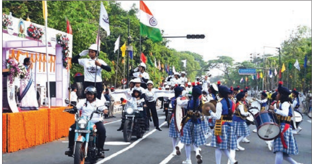
ପିଏମ୍‌ଜିଠାରେ ରାଜଧାନୀ ପ୍ରତିଷ୍ଠା ଦିବସର ଝଲଝ