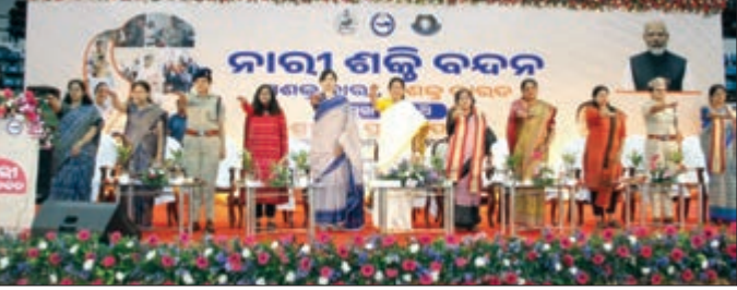
ଉପମୁଖ୍ୟମନ୍ତ୍ରୀ ପ୍ରଭାତୀ ପରିଡ଼ା ଉପମୁଖ୍ୟମନ୍ତ୍ରୀ ପ୍ରଭାତୀ ପରିଡ଼ାଙ୍କ ଦ୍ୱାରା ଉଦ୍ଘାଟିତ ହୋଇଥିଲା।

କଟକ, ୧୩/୪/୨୦୨୬: ସ୍ଥାନୀୟ ଇଣ୍ଡୋର ଷ୍ଟାଡ଼ିୟମରେ ନାରୀଶକ୍ତି ବନ୍ଦନ ସମ୍ମିଳନୀ ଉପମୁଖ୍ୟମନ୍ତ୍ରୀ ପ୍ରଭାତୀ ପରିଡ଼ାଙ୍କ ଦ୍ୱାରା ଉଦ୍ଘାଟିତ ହୋଇଯାଇଛି। ଏହି କାର୍ଯ୍ୟକ୍ରମରେ ଉପମୁଖ୍ୟମନ୍ତ୍ରୀ ପ୍ରଭାତୀ ପରିଡ଼ା ପ୍ରାୟ ୫୦୦ ଲୋକଙ୍କ ସମ୍ମାନେ ଉପସ୍ଥିତ ରହିଥିଲେ।