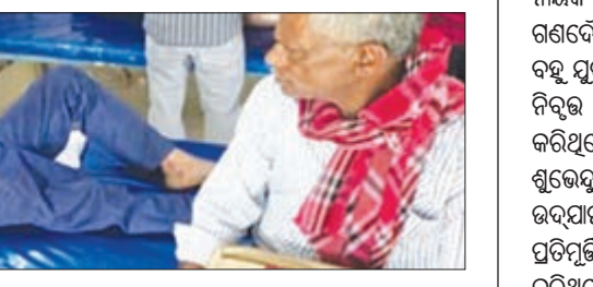
ଆରାମରେ ଭୋଜନ ସାରି ନିଜ ନିଜ ଗନ୍ତବ୍ୟ ସ୍ଥଳକୁ ପ୍ରତ୍ୟାବର୍ତ୍ତନ କରିଥିଲେ। ହଠାତ୍ ଏକ ବିରାଟ କାଢ଼ି ବରଗଛର ବାଢ଼ି ଭାଙ୍ଗି ପର୍ଯ୍ୟଟକଙ୍କ ଉପରେ ପଡ଼ିବାରୁ ସେ ଗୁରୁତର ଭାବେ ଆହତ ହୋଇଛନ୍ତି।

କଟକ, ୨୨୧୪/ଏନ୍-ଏନ୍-ଏ: ପୁଲୁ ଶ୍ରୀ ନୀଳମାଧବ ଜିଉ ବିଜେ କର୍ମିଣ୍ଡୋର ପୂର୍ବ ପାର୍କ୍ ପାର୍କ୍ ସ୍ଥଳରେ ଏକ ବିରାଟ କାଢ଼ି ବରଗଛର ବାଢ଼ି ଭାଙ୍ଗି ଜଣେ ବଙ୍ଗାଳୀ ପର୍ଯ୍ୟଟକଙ୍କ ଉପରେ ପଡ଼ିବାରୁ ସେ ଗୁରୁତର ଭାବେ ଆହତ ହୋଇଛନ୍ତି।