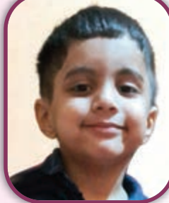
ଆଦ୍ୟକ୍ଷ ମହାରଣା, ବିଦ୍ୟା ବାଲଭବନ ପବ୍ଲିକି ଷ୍ଟଲ୍, ଅଶୋକ ନଗର, ନୂଆଦିଲ୍ଲୀ