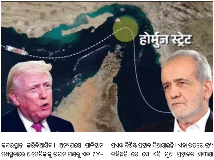
କବରସ୍ଥାନ କରିଦିଆଯିବ । ଅନ୍ୟପକ୍ଷେ ପାକିସ୍ତାନ ମଧ୍ୟସ୍ଥଗରେ ଆମେରିକୀୟ ଇରାନ ପକ୍ଷରୁ ଏକ ୧୪-ପଏଣ୍ଟ ସିଣ୍ଡିକେଟ୍ ପ୍ରସ୍ତାବ ଦିଆଯାଇଛି । ଏହା ଉପରେ ଟ୍ରମ୍ପ୍ କହିଛନ୍ତି ଯେ ସେ ଏହି ଦୁଆ ପ୍ରସ୍ତାବର ସମୀକ୍ଷା