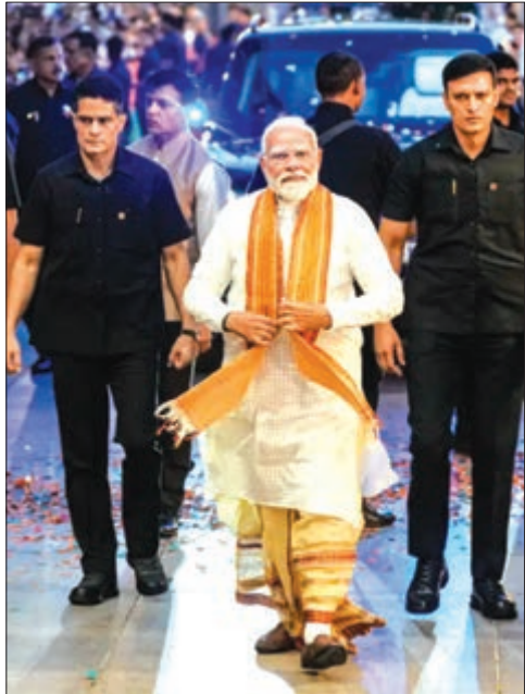
ମମତାଙ୍କୁ ମହତ୍ତ୍ୱପୂର୍ଣ୍ଣ ମହିଳାଙ୍କ ପ୍ରତି ଉଦ୍‌ଘାଟନା, ମୁସଲିମ୍ ଭୋଟର ବି ହାତ ଛାଡ଼ିଲେ

କୋଲକାତା, ୪୫/ଏକେନ୍ଦ୍ରି: ପଶ୍ଚିମବଙ୍ଗରେ ପ୍ରଥମ ଥର ପାଇଁ ବିଜେପି ସରକାର ଗଠନ କରିବାକୁ ଜନଦେଶ ପାଇଛି । ସୁଦୂର ଅନୁପ୍ରାୟା, ବିଜେପି ଏଥର ୨୦୮ ବିଧାନସଭା ଆସନ ଅଧିକାର କରିବାରେ ସଫଳ ହୋଇଛି, ଯାହାକି ଏକ ବଡ଼ ଐତିହାସିକ ଘଟଣାକୁ ଦର୍ଶାଇଛି । ୨୦୧୧ରେ ବିଜେପି ଏଠାରେ ମାତ୍ର ୬୭ ଆସନ ଜିତିବାରେ ସମର୍ଥ ହୋଇଥିବା ବେଳେ ଏଥର କିଛି ୧୩୧ ଅତିରିକ୍ତ ଆସନ ଜିତିଛି । ତେବେ ବିଜେପି ଖାତାକୁ ଆସିଥିବା ଏହି ଅତିରିକ୍ତ ଆସନକୁ ନେଇ ଚର୍ଚ୍ଚା ଜୋର ଧରିଛି । କାରଣ ବିଜେପି ଖାତାକୁ ଆସିଥିବା ଏହି ଅତିରିକ୍ତ ଆସନ ମଧ୍ୟରୁ ପ୍ରାୟ ୫୮% ଆସନ ଟିଏମ୍‌ସି ଗଢ଼ ଭାବେ ପୂର୍ବରୁ ବିଜେପିର ହୋଇଥିଲା । ଯଦି ଭୋଟ ସେୟାର କଥା କହିବା ତେବେ ୨୦୨୧ ଡିସେମ୍ବର ୨୦୨୨ରେ ବିଜେପିର ଭୋଟ ମାତ୍ର ୭% ବୃଦ୍ଧି ପାଇଥିବା ଦେଖିବାକୁ ମିଳୁଥିଲେ ମଧ୍ୟ ଆସନ ସଂଖ୍ୟା କିଛି ୧୩୧ଟି ବୃଦ୍ଧି ପାଇଛି । ଏହାର ଅର୍ଥ ୧୫ ବର୍ଷ ଧରି ନିରନ୍ତର କ୍ଷମତା ଉପଭୋଗ କରିଆସୁଥିବା ମମତା ବାନାର୍ଜୀ ନିଜ ଗଢ଼କୁ ମଧ୍ୟ ଏଥର ରକ୍ଷା କରିପାରିଲେ ନାହିଁ । ଯେଉଁ ୧୧୯ଟି ସିଟ୍‌ରେ ଟିଏମ୍‌ସି ଗଢ଼ ୧୫ ବର୍ଷ ଧରି କ୍ରମାଗତ ଭାବେ କବ୍‌ଜା କରି ରଖିଥିଲା, ସେଥିମଧ୍ୟରୁ ୬୯ଟି ଆସନ ଅର୍ଥାତ୍ ପ୍ରାୟ ୫୮% ଆସନ ବିଜେପି ଛଡ଼ାଇ ବିଜେପିର ସଠିକ୍ ରଖିବାରେ ବିଜେପିର ଗୁରୁତ୍ୱପୂର୍ଣ୍ଣ ଭୂମିକା ଗ୍ରହଣ କରିବାକୁ ସମର୍ଥ ହୋଇଛି ।