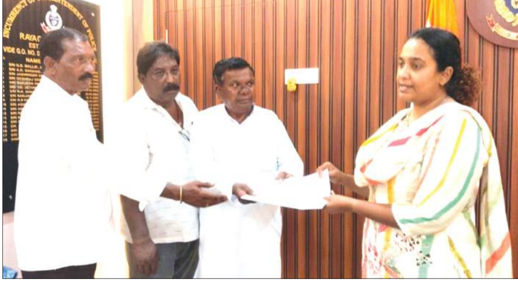
ରହିଛି ବୋଲି ଅଞ୍ଚଳବାସୀ କହିଛନ୍ତି । ଉକ୍ତ ଦାବିପତ୍ରରେ ଉଲ୍ଲେଖ କରାଯାଇଛି ଯେ କାଶୀପୁର ରୁକ୍ତର ଲୋକମାନେ ଅତ୍ୟନ୍ତ ସରଳ ବ୍ୟାପୀ । ତେଣୁ ଏହାର ସୁଯୋଗ ନେଇ ବାହାର ରାଜ୍ୟ ଫରଠନ ଆମ ଅଞ୍ଚଳରେ ପ୍ରବେଶ କରି ନିଜର ମନ୍ଦ ଉଦ୍ଦେଶ୍ୟ ରଖୁ

ରାୟଗଡ଼ା, ୨୦୫/ଏନ୍-ଏନ୍-ଏସ୍: ରାୟଗଡ଼ା ଜିଲ୍ଲାର କାଶିପୁର ସିଜିମାଳି ଅଞ୍ଚଳରେ କିଛିଦିନ ଧରି ଲାଗିରହିଥିବା ଅଶାନ୍ତ ପରିସ୍ଥିତି ଧୀରେ ଧୀରେ ଶାନ୍ତ ହେଉଥିବାବେଳେ ପୁଣି ଅଶାନ୍ତ କରିବା ପାଇଁ ବାହାର ଜିଲ୍ଲା ଓ ରାଜ୍ୟର ଦ୍ୱାମାଳିକ ଅନୁଷ୍ଠାନ ବା ଅନ୍ୟାନ୍ୟ ଫରଠନ ଦ୍ୱାରା ପଦଯତ୍ନ ବାହାନରେ ସ୍ଥାନୀୟ ଲୋକଙ୍କୁ ଉପକାଳିତ ହିଂସା ସୃଷ୍ଟି କରିବାକୁ ପ୍ରୟାସ କରାଯାଉଛି । ଏହାକୁ ବନ୍ଦ କରିବା ପାଇଁ କାଶିପୁର ଅଞ୍ଚଳବାସୀ ଜିଲ୍ଲାପାଳ ଏବଂ ଏସ୍ପିଙ୍କୁ ଦାବିପତ୍ର ପ୍ରଦାନ କରିଛନ୍ତି । କାଶୀପୁର ଏକ ସମ୍ବେଦନଶୀଳ ଅଞ୍ଚଳ । ଦୀର୍ଘ ଦିନ ଧରି କଂଗ୍ରେସ ଏବଂ ସାମବାନି ଗ୍ରାମବାସୀଙ୍କୁ ନେଇ ପରିବେଶ ସୁରକ୍ଷା ନାମରେ ଫାଲ୍ସ ସୁପ୍ରିମ ଯେଠାରେ ତେରା ପକାଇ ଆନ୍ଦୋଳନ କରୁଥିବାବେଳେ ଆସନ୍ତା ୨୨ରୁ ୨୮ ଗରିଷ୍ଠ ପର୍ଯ୍ୟନ୍ତ ସିଜିମାଳିକୁ ଜିଲ୍ଲାପାଳ କାର୍ଯ୍ୟାଳୟ ପର୍ଯ୍ୟନ୍ତ ପଦଯତ୍ନ ଆରମ୍ଭ କରିବା ନେଇ କିଛି ଫରଠନ ଯୋଜନା ପ୍ରସ୍ତୁତ କରିଛି । ଏନେଇ ପୁଣି ଅଞ୍ଚଳରେ ଅଶାନ୍ତ ସୃଷ୍ଟି ହେବାର ସମ୍ଭାବନା