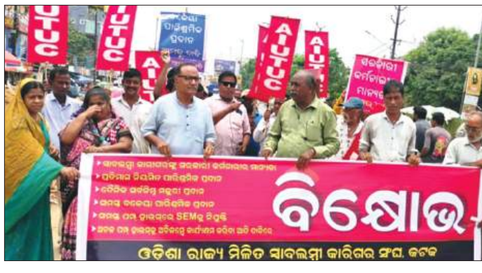
ମୁଖ୍ୟମନ୍ତ୍ରୀଙ୍କୁ ଏକ ସ୍ୱାକ୍ଷରୀ ବହି ଉତ୍ତୀର୍ଣ୍ଣ କରିଥିବା ପ୍ରଦାନ କରାଯାଇଥିଲା ।

କଟକ, ୨୦୧୫/ଏନ୍ଏସଏସ୍: ଏଆଇୟୁସିୟୁ ସହଯୋଗୀ ଉତ୍ତୀର୍ଣ୍ଣ ମିଳିତ ସ୍ୱାକ୍ଷରୀ କାରିଗର ସଂଘ କଟକ ସଦର ବୁକ୍ କମିଟି ପକ୍ଷରୁ ଆଜି ବୁକ୍ ଅର୍ପଣ ସମ୍ମୁଖରେ ବିଷୋଭ ପ୍ରଦର୍ଶନ କରାଯାଇଛି । ସ୍ୱାକ୍ଷରୀ କାରିଗରମାନେ ବିନା ଛୁଟିରେ କାମ କରୁଛନ୍ତି କିନ୍ତୁ ସେମାନଙ୍କୁ ସରକାରୀ କର୍ମଚାରୀ କିମ୍ବା ଦୈନିକ ସର୍ବନିମ୍ନ ମଜୁରୀ ପ୍ରଦାନ କରାଯାଉ ନାହିଁ । ପ୍ରତି ମାସରେ ଦରମା ଦିଆ ଯାଉନାହିଁ ।