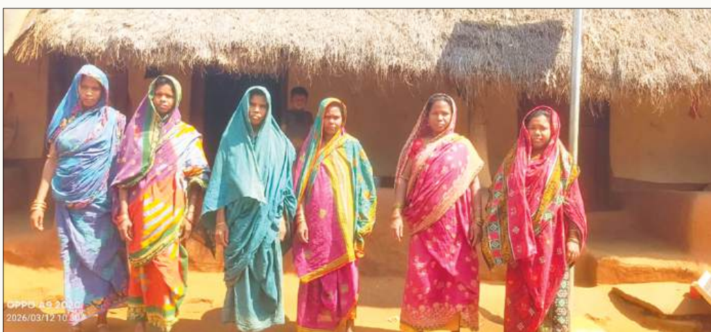
ଓଡ଼ିଶା ଆଦିବାସୀ ଗାଁଗୁଡ଼ିକରେ ଦେଶୀମଦ ବ୍ୟବସାୟର ଧାରଣ କରାଯାଇଛି ।

ଓଡ଼ିଶା, ୨୮/୫/୨୦୨୬: ଓଡ଼ିଶା ଆଦିବାସୀ ଗାଁଗୁଡ଼ିକରେ ଦେଶୀମଦ ବ୍ୟବସାୟର ଧାରା ଧାରୀ ଭାବେ ଧାରଣ କରାଯାଇଛି । ଦେଶୀମଦ ବ୍ୟବସାୟର ଧାରଣ କରାଯାଇଛି । ଦେଶୀମଦ ବ୍ୟବସାୟର ଧାରଣ କରାଯାଇଛି ।