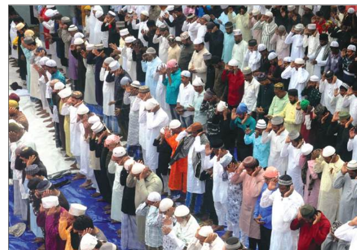
ପବିତ୍ର ଇଦ୍-ଉଜ୍-ଜୁହା ଅବସରରେ ଭୁବନେଶ୍ୱରସ୍ଥିତ ଝରପଡ଼ା ଇଦ୍ଗା ପଡ଼ିଆରେ ପୂର୍ବଲମ୍ପାଫା ଭାଇମାନଙ୍କ ସମବେଦ ନମାଜ ପାଠ