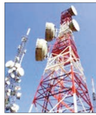
ଭୁବନେଶ୍ୱର, ୧୮/୬/୨୦୨୬: ଡିଜିଟାଲ ଭାରତ ନିଧିରେ ୭୦୦୦ ବର୍ଗଫୁଟ ସରକାରୀ ଜମିରେ ଟାଊର ସ୍ଥାପନ କରାଯିବ । ଏପର୍ଯ୍ୟନ୍ତ ୨୯୪ଟି ସ୍ଥାନ ପାଇଁ ଏନ୍‌ଡିଏ ପ୍ରଦାନ କରାଯାଇଥିବାରୁ ସେହି ଅଞ୍ଚଳଗୁଡ଼ିକରେ ପ୍ରକଳ୍ପର କାର୍ଯ୍ୟ ଦ୍ରୁତରେ ହୋଇଛି । ଅବଶିଷ୍ଟ ସ୍ଥାନଗୁଡ଼ିକରେ ମଧ୍ୟ ଶୀଘ୍ର କାର୍ଯ୍ୟ ସମାପ୍ତ କରିବା ଲକ୍ଷ୍ୟରେ ଜିଲ୍ଲାପାଳଙ୍କୁ ଅଧିକାରୀମାନଙ୍କୁ ଆବଶ୍ୟକ ପଦକ୍ଷେପ ନେବାକୁ କୁହାଯାଇଛି । କେନ୍ଦ୍ର ସରକାରଙ୍କ