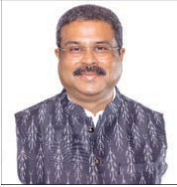
ଜଣେ ସାଧାରଣ ମଣିଷ ଭଗବାନଙ୍କ ଉପରେ ନିଜର ଅଧିକାର କାହିଁକି କରେ ଏବଂ ପୁଣି ମଧ୍ୟ ଭକ୍ତର ହୃଦାଁର ଶୁଣି ଡା’ର ସୁଖ-ଦୁଃଖରେ ସାମିଲ

ସମ୍ବଲପୁର, ୧୮/୬/୨୦୨୬: ଓଡ଼ିଶାର ଗୌରବପୂର୍ଣ୍ଣ ସଂସ୍କୃତିକ ତଥା ଆଧ୍ୟାତ୍ମିକ ପର୍ବ ପବିତ୍ର ଶୀତଳ ଷଷ୍ଠୀ ଅବସରରେ ସମଗ୍ର ଓଡ଼ିଶାବାସୀ, ବିଶେଷ କରି ସମ୍ବଲପୁରର ଗୁରୁଜନ, ମା’ ଭଗବାଣୀ ଓ ଭାଗ୍ୟାଳୟ ଏକ ଛିଡ଼ି ଓ ବାଣୀ ଯୋଗେ ଧାର୍ମିକ ଶୁଭକାର୍ଯ୍ୟ ଓ ଅଭିନନ୍ଦନ ଜଣାଇଛନ୍ତି କେନ୍ଦ୍ର ଶିକ୍ଷା ମନ୍ତ୍ରୀ ତଥା ସମ୍ବଲପୁର ସଂସଦ ଧର୍ମେନ୍ଦ୍ର ପ୍ରଧାନ । ଶ୍ରୀ ପ୍ରଧାନ ଶୀତଳ ଷଷ୍ଠୀ ବୈଷିଷ୍ଠ୍ୟ ଉପରେ ଆଲୋଚନା କରି କହିଛନ୍ତି ଯେ, ଶୀତଳ ଷଷ୍ଠୀ ଓଡ଼ିଆ ସଂସ୍କୃତିର ଅନନ୍ୟ ଗାରିମା । ଶୀତଳ ଷଷ୍ଠୀର ସର୍ବୋଚ୍ଚ ବଡ଼ ସ୍ୱତନ୍ତ୍ରତା ହେଉଛି ଏହାର ‘ମାନବୀୟ ଲୀଳା’ । ଯେଉଁଠି ସ୍ୱର୍ଗ ଭଗବାନ ଜଣେ ସାଧାରଣ ମଣିଷ ଭଳି ବରଯାତ୍ରୀ ନେଇ କନ୍ୟାପିତାଙ୍କ ଦୁଆରକୁ ଯାଆନ୍ତି । ଏହି ଉତ୍ସବରେ