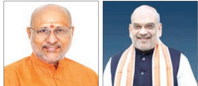
ଭୁବନେଶ୍ୱର, ୨୩/୬/୨୦୨୬: ଏକ ସମ୍ବନ୍ଧରେ

ଆସନ୍ତା ଜୁଲାଇ ୯ ତାରିଖରେ ଓଡ଼ିଶା ଗସ୍ତରେ ଆସିବେ ଭାରତର ଉପରାଷ୍ଟ୍ରପତି ଡି.ପି ରାଧାକ୍ରିଷ୍ଣନ । ଭୁବନେଶ୍ୱରରେ ଅନୁଷ୍ଠିତ ଓଡ଼ିଆ କାର୍ଯ୍ୟକ୍ରମରେ ସେ ସାମିଲ ହେବାର କାର୍ଯ୍ୟକ୍ରମ ରହିଛି । ଉଚ୍ଚ କାର୍ଯ୍ୟକ୍ରମରେ ରାଜ୍ୟପାଳ, ମୁଖ୍ୟମନ୍ତ୍ରୀ ଓ କେନ୍ଦ୍ର କୃଷିମନ୍ତ୍ରୀ ଶିବରାଜ ଦି' ତୌହାନ ମଧ୍ୟ ଯୋଗଦେବାର ସୂଚନା ରହିଛି । ଦିନିକିଆ ଗସ୍ତରେ ଆସୁଥିବା ଉପରାଷ୍ଟ୍ରପତି ଭୁବନେଶ୍ୱରରେ ଅନ୍ୟାନ୍ୟ ସରକାରୀ ଓ ସାମାଜିକ କାର୍ଯ୍ୟକ୍ରମରେ ମଧ୍ୟ ଯୋଗଦେବେ ଏବଂ ବିଶିଷ୍ଟ ବ୍ୟକ୍ତିମାନଙ୍କ ସହ ସାକ୍ଷାତ କରିବେ । ଅନ୍ୟପକ୍ଷେ ଉପରାଷ୍ଟ୍ରପତିଙ୍କ ଗସ୍ତର ଠିକ୍ ୫ ଦିନ ପୂର୍ବରୁ ଅର୍ଥାତ୍ ଜୁଲାଇ ୪ ତାରିଖରେ କେନ୍ଦ୍ର ସ୍ୱରାଷ୍ଟ୍ର ମନ୍ତ୍ରୀ ଅମିତ୍ ଶାହ ଓଡ଼ିଶା ଗସ୍ତରେ ଆସିବାର କାର୍ଯ୍ୟକ୍ରମ ସ୍ଥିର କରାଯାଇଛି । ଏହି ଗସ୍ତ ଅବସରରେ ସେ ରାଜ୍ୟରେ ଆୟୋଜିତ ହେବାକୁ ଥିବା ବିଭିନ୍ନ