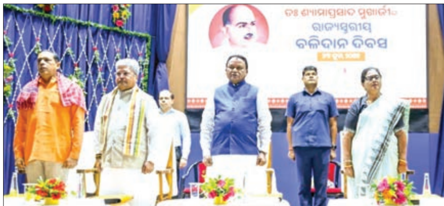
ରାଷ୍ଟ୍ରକୁ ଏକତର ସୂତ୍ରରେ ବାନ୍ଧିଥିଲା ।

ଭାରତ ମାତାର ମହାନ ସୁପୁତ୍ର ଡଃ ଶ୍ୟାମାପ୍ରସାଦ ମୁଖାର୍ଜୀଙ୍କ 'ରାଷ୍ଟ୍ର ପ୍ରଥମ' ନୀତିରେ ଅନୁପ୍ରାଣିତ ହୋଇ ପବିତ୍ର ଓଡ଼ିଶା ମାଟି ତଥା ସମଗ୍ର ଭାରତବର୍ଷକୁ ସଶକ୍ତ, ସମୃଦ୍ଧ ଓ ଏକତର ସୂତ୍ରରେ ବାନ୍ଧି ରଖିବା ପାଇଁ କାର୍ଯ୍ୟ କରିବାକୁ ପୂର୍ବପିତୃ ବନ୍ଧୁ ଶପଥ ନେବାକୁ ହେବ ।