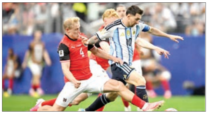
ମାର୍‌ଭେଲ୍ ସାଇଡ୍‌ଲର ନିଜ ୧୦୦ତମ ଅନ୍ତର୍ଜାତୀୟ ମ୍ୟାଚ୍‌ରେ ଆଜେଷ୍ଟିନା ପ୍ରତିଦ୍ୱନ୍ଦ୍ୱୀ ଭାବେ ମେସି ଗୋଲ୍‌ରେ ପରିବର୍ତ୍ତନ କରିପାରି ନଥିଲେ । ଏହି ଡବଲ୍

ଡିଫେଣ୍ଡିଂ ଚାମ୍ପିଅନ୍ ଆଜେଷ୍ଟିନା ପାଇଁ ଲିଓନେଲ୍ ମେସି ପୁଣିଥରେ ସକ୍ଷମତା ଦେଖାଇଛନ୍ତି । ତଳାୟ ଷ୍ଟାର୍‌ମ୍ୟୁରେ ଖେଳାଯାଇଥିବା ମ୍ୟାଚ୍‌ରେ ଆଜେଷ୍ଟିନା ୨-୦ରେ ଅଷ୍ଟ୍ରିଆକୁ ହରାଇ ଦେଇଛି । ମେସି ୩୮ତମ ମିନିଟ୍‌ରେ ଚମତ୍କାର ଗୋଲ୍ କରି ଆଜେଷ୍ଟିନାକୁ ଆଗ୍ରଣୀ କରିଥିଲେ । ଫାଲ୍‌ଗୋ ମେଡିନାଙ୍କ ଏକ ଉନ୍ନତ ପାସକୁ ମେସି ଗୋଲ୍‌ପୋଷ୍ଟର ନିମ୍ନ ଭାଗରେ ପହଞ୍ଚି ଷ୍ଟାର୍ ୧-୦ କରିଥିଲେ । ଏହାପରେ ଜର୍ମାନୀ ଟାକମ୍‌ର ପଞ୍ଚମ ମିନିଟ୍‌ରେ ଦ୍ୱିତୀୟ ଗୋଲ୍ ଦେଇ ଟିମ୍‌ର ବିଜୟ ଉପରେ ମୋହର ଲଗାଇଥିଲେ । ମ୍ୟାଚ୍‌ରେ ଅଷ୍ଟ୍ରିଆ ମଧ୍ୟ ସଫର୍ପ କରିଥିଲା ।