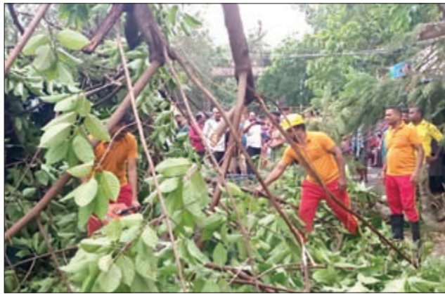
ଭୁବନେଶ୍ୱର, ୬/୬/୨୦୨୬: ଏକ ଗାଡ଼ି ଉପରେ ଉପରୁ ଖସି ଆସିଥିବା ଗଛର ଖୁଣ୍ଟା ଫାଟି ଗାଡ଼ିକୁ ଘେରି ରହିଛି।

କଳାହାଣ୍ଡିଆ ମେଘର ତାଣ୍ଡବ ଧରଣର ଭୁବନେଶ୍ୱର, କିଛି ମିନିଟରେ ପୂର୍ଣ୍ଣ ଛାଉଣୀରୁ ଭାଙ୍ଗିଲେ ଗଛ, ଗାଡ଼ି ହେଲା ଗାଡ଼ି, କାମ୍ ହେଲା ଗାଡ଼ି। ଯାହା ଦିନର ଗୁଳୁଗୁଳି ଭିତରେ ଶନିବାର ଅପରାହ୍ଣରେ ରାଜଧାନୀରେ ଘଟିଥିଲା କାଳବୈଶାଖୀ। ଶନିବାର ସକାଳେ ପାଉଁଶ ଉପରୁ ଖୁଣ୍ଟା ଖସି ପଡ଼ିଲା। ଏକାକୀ ସମୟରେ ଘରୁ ବାହାରିବା ବେଳେ ଗୁଳୁଗୁଳି ଥିଲା। ଗୁଳୁଗୁଳିରେ ଲୋକେ ଅସ୍ୱାସ୍ଥ୍ୟ ହୋଇପାରୁଥିଲେ। ତେବେ ଅପରାହ୍ଣ ପାଖାପାଖି ଗାଟା ବେଳକୁ ଗାଡ଼ିଗାଡ଼ି ଘୋଡ଼ିଆଥିଲା ମେଘ। ଆଉ ତତ୍ପରେ ଆର୍ଦ୍ର ତିନା ଭିତରେ ଅକ୍ଷର କରି ଆରମ୍ଭ କରିଦେଇଥିଲା ତାଣ୍ଡବ। ଦିନସାରା