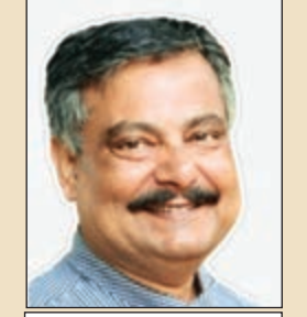
ସୁଭୋଜିତ ଦାସ : ବସନ୍ତ ବନ୍ଦୁ ଓଡ଼ିଆ ଅନୁବାଦ : ମୃଗାଳ

ଅନେକ କରୁଣ ଓ ସୁଖକର ଘଟଣାରେ ପରିପୂର୍ଣ୍ଣ ଏହି ଉପନ୍ୟାସ। କେବଳ ସେତିକି ନୁହେଁ ଅନେକ ପୁରୁଣା ନିତ୍ୟ ବ୍ୟବହୃତ ଜିନିଷ ଯଥା ହେଁସ, ମାସିଣା, ଦାପ, ଡିବି, ଲଗ୍ଗିନ, ପେଡ଼ୋମାଟ୍, ଘୋଗାଗି, ହାତରୁଣା ଗାମୁଛା ଓ ଲୁଗା, ହଳ, ଲଜ୍ଜକ, ପଣିଆ, ଖଣ୍ଡା, ପାଲିକି,