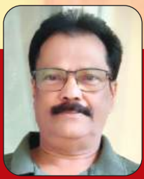
ସେନାପତି ପ୍ରଭୁମୁଁ କେଶରୀ

କିଏ ନ ଜଣେ ଯେ ବୋଧିରେ ଏକ ନୟନ କଟକ ପ୍ରେମରେ ଓହ୍ଲାଇ, ମନ ଦେବାରେ ମଧ୍ୟ ଟିକେ ଭାଲଗାଏ ପାଇବଲେ ଆପେ ହୋଇଯାଏ କଟକର ମଥା ନତ !