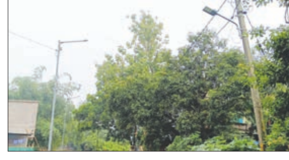
କୋଣାର୍କ ଏନ୍‌ଏସିର ୧୧ ନଂ ଖୁଡ଼ିର ଅନ୍ଧାରର ରାତ୍ରି ଚାଲିଥିବା ଦେଖିବାକୁ ମିଳିଛି।

କୋଣାର୍କ, ୨୨/୬/୨୦୨୨: କୋଣାର୍କ ଏନ୍‌ଏସିର ୧୧ ନଂ ଖୁଡ଼ିର ଅନ୍ଧାରର ରାତ୍ରି ଚାଲିଥିବା ଦେଖିବାକୁ ମିଳିଛି। ୧୧ ନଂ ଖୁଡ଼ିର ନିକଟସ୍ଥ ଗ୍ରାମର ଦକ୍ଷିଣ ପାର୍ଶ୍ୱରେ ୧୦ ଗୋଟି ଓ ପଶ୍ଚିମପାର୍ଶ୍ୱରେ ୧୫ ଗୋଟି ସମୁଦାୟ ୧୫ ଗୋଟି ଖୁଡ଼ିରେ ଖୁଡ଼ି ଲାଇଟ୍ ଚାଲିବାର ବ୍ୟବସ୍ଥା ହେବ।