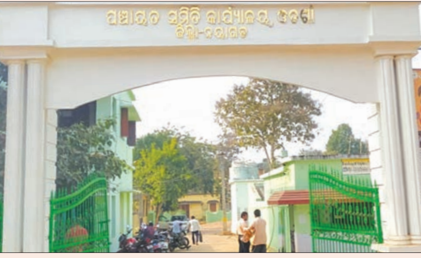
କାହ୍ନୁ ଚରଣ ବେହେରାଙ୍କ ମଧ୍ୟ ବଦଳି ହୋଇଛି । ଗାଦିମାଡ଼ି ବସିଥିବା କର୍ମଚାରୀଙ୍କ ପ୍ରତି ସହାନୁଭୂତି ପ୍ରସ୍ତୁତ ହେଉଛି ଓଡ଼ିଶା ବୁକ୍ସର ୮ ବର୍ଷରୁ ଅଧିକ ଦିନଧରି ଦେଖାଇବା ପଛର କାରଣ କ'ଣ ବୋଲି ପ୍ରଶ୍ନ ଉଠିଛି ।

ଓଡ଼ିଶା, ୨୨/୬/୨୦୨୨: ଓଡ଼ିଶା ବୁକ୍ସର ବଡ଼ବାବୁ, କ୍ୟାସିୟର୍ ଓ ଡେଭେଲପମେଣ୍ଟ କର୍ମଚାରୀଙ୍କୁ ବଦଳି କରି ବାହାବା ନେଇଛି ପ୍ରଶାସନ ବଡ଼ବାବୁଙ୍କର ୮ମାସ ଚାକିରି ଥିବା ବେଳେ ଠାକୁ ନୟାଗଡ଼ ଜିଲ୍ଲା ଅଫିସକୁ ନିଆଯାଇଛି । ଫଳରେ ଓଡ଼ିଶା ବୁକ୍ସର ଉନ୍ନୟନମୂଳକ କାର୍ଯ୍ୟ ଏକପ୍ରକାର ଠପ ହୋଇଯାଇଥିବା ଜଣାପଡ଼ିଛି ।